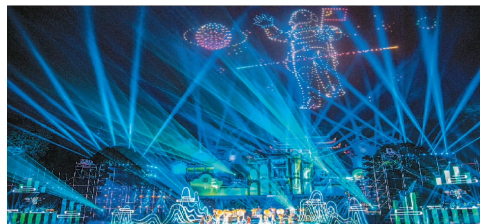
将三峡大坝、屈原祠实景与全息投影、地平投射等技术相结合的大型原创音舞诗画《楚辞里的中国》日前在湖北省宜昌市秭归县上演。

国家网信办有关负责人表示，互联网用户账号信息治理需要政府、企业、网民等多方主体共同参与，弘扬社会主义核心价值观，维护国家和社会公共利益，营造更加清朗的网络空间。