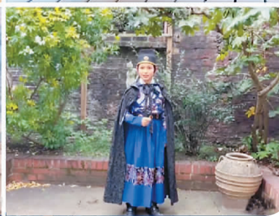
第十九届全英普通话朗诵比赛部分选手参赛视频截图。