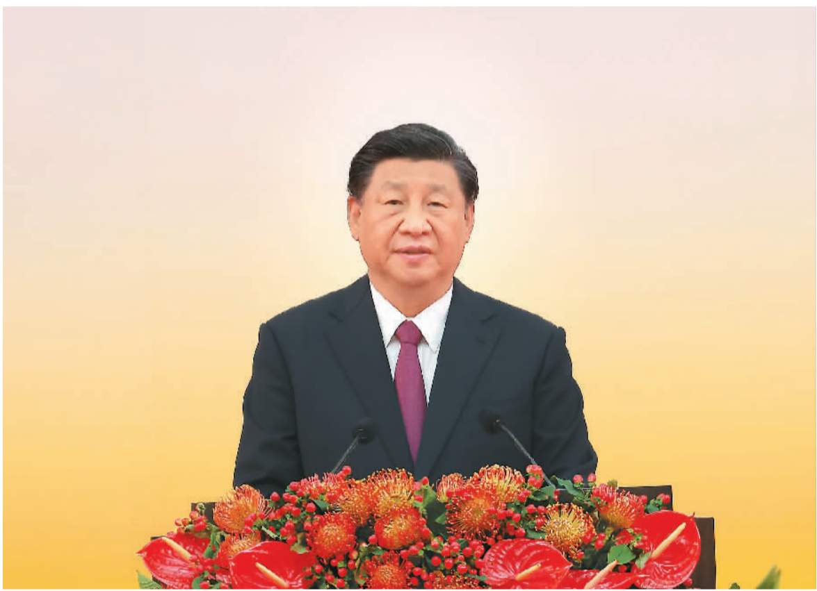
7月1日上午,庆祝香港回归祖国25周年大会暨香港特别行政区第六届政府就职典礼在香港会展中心隆重举行。中共中央总书记、国家主席、中央军委主席习近平出席并发表重要讲话。

习近平强调,25年来,在祖国全力支持下,在香港特别行政区政府和社会各界共同努力下,“一国两制”实践在香港取得举世公认的成功。“一国两制”是经过实践反复检验了的,符合国家、民族根本利益,符合香港、澳门根本利益,得到14亿多中国人民鼎力支持,得到香港、澳门居民一致拥护,也得到国际社会普遍赞同。这样的好制度,没有任何理由改变,必须长期坚持