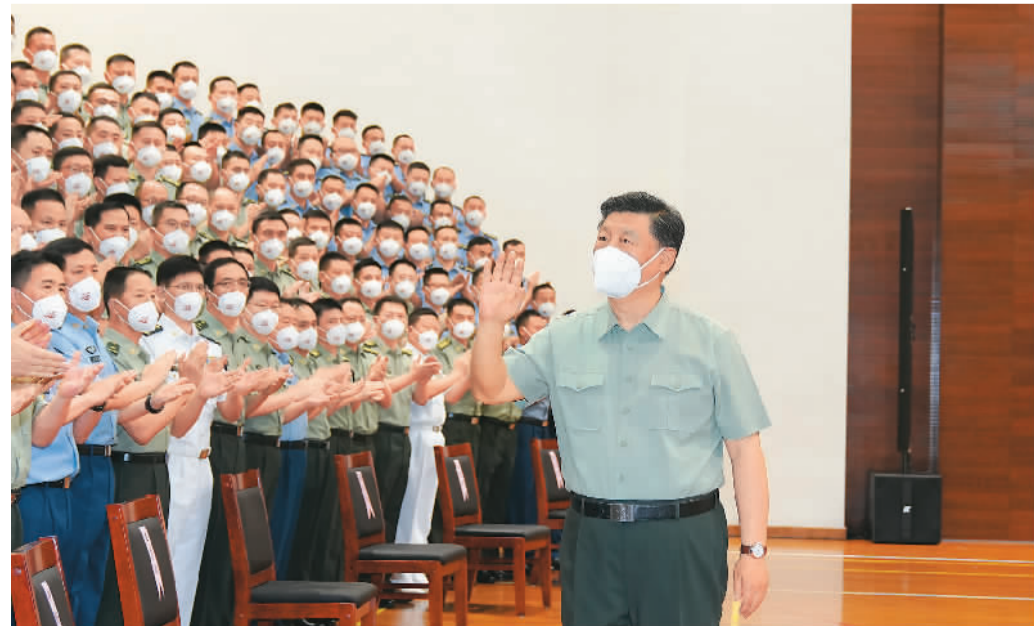
七月一日,中共中央总书记、国家主席、中央军委主席习近平视察了中国人民解放军驻香港部队,代表党中央和中央军委,向驻香港部队全体同志致以诚挚的问候。这是习近平亲切接见驻香港部队官兵代表。