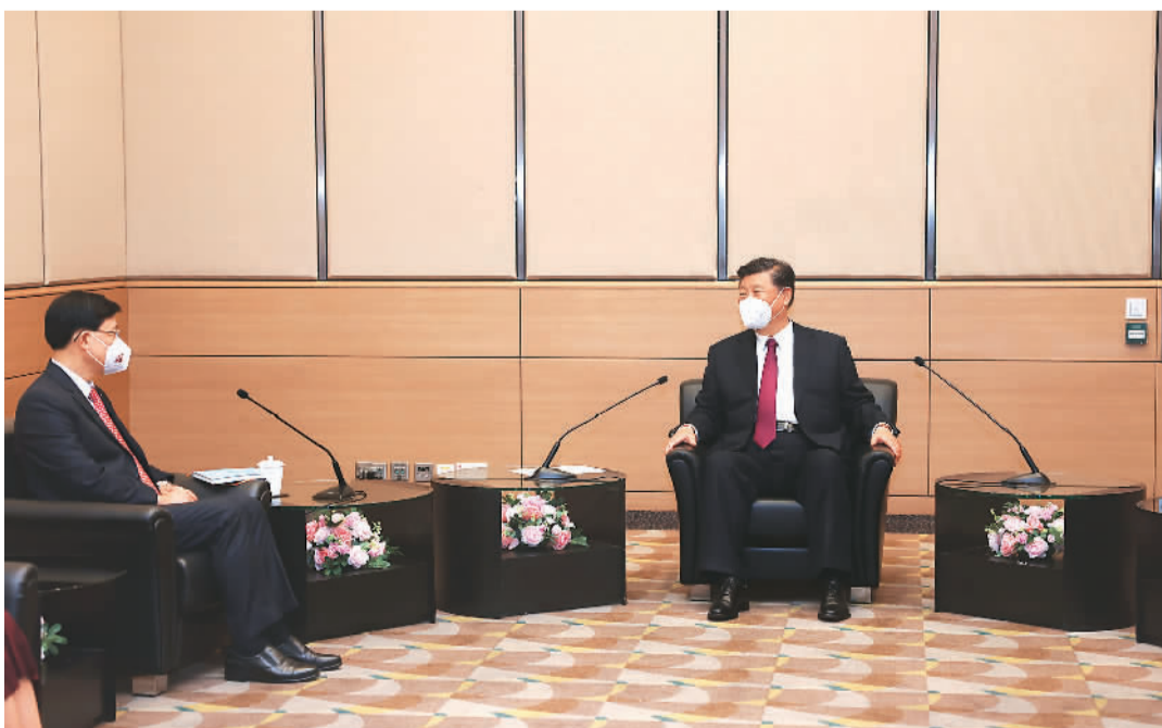
七月一日上午,国家主席习近平在香港会见刚刚就任的香港特别行政区行政长官李家超。