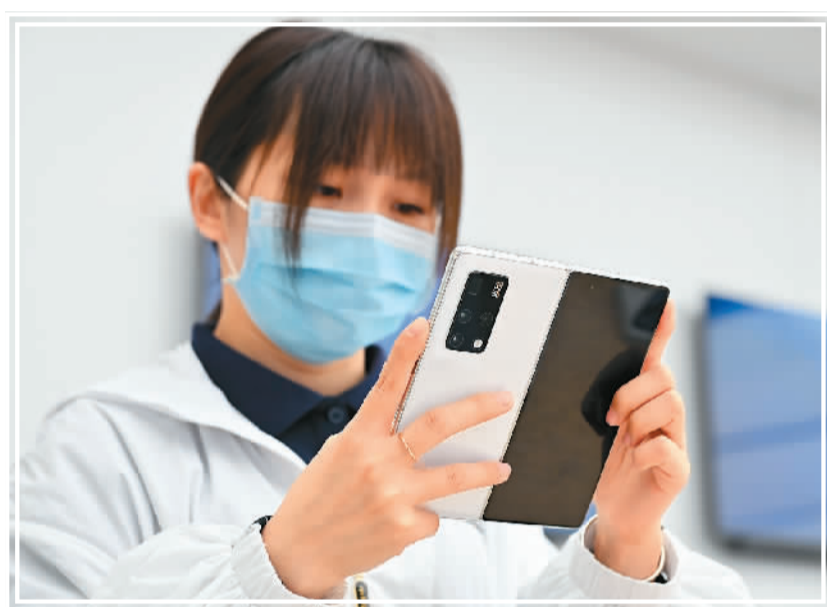
▲在位于重庆市沙坪坝区的金沙天街华为授权体验店，消费者选购折叠屏手机。

让屏幕犹如悬浮于铰链之上，在更窄的开合空间内创造更好的屏幕平整度，保证屏幕开合的长寿命和轻折痕。”荣耀产品开发部工程师说。