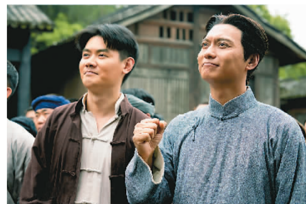
电视剧《数风流人物》