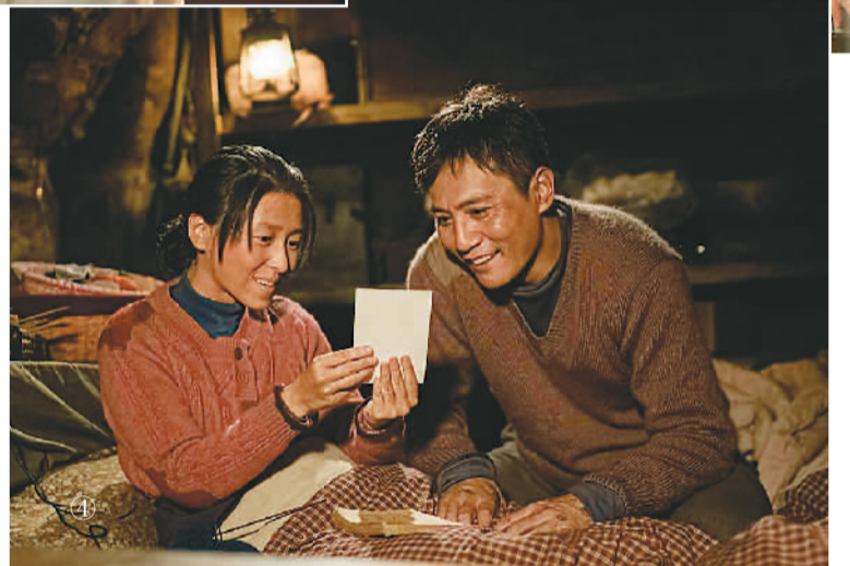
①电视剧《觉醒年代》 ②电影《决胜时刻》 ③电影《1921》 ④电影《守岛人》