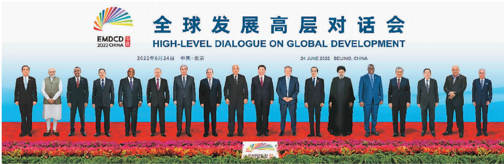
6月24日晚, 国家主席习近平在北京以视频方式主持全球发展高层对话会并发表题为《构建高质量伙伴关系 共创全球发展新时代》的重要讲话。这是与会各国领导人的“云合影”。

新华社北京6月24日电(记者杨依军) 国家主席习近平24日晚在北京以视频方式主持全球发展高层对话会并发表重要讲话。阿尔及利亚总统特本、阿根廷总统费尔南德斯、埃及总统塞西、印度尼西亚总统佐科、伊朗总统莱希、哈萨克斯坦总统托卡耶夫、俄罗斯总统普京、塞内加尔总统萨勒、南非总统拉马福萨、乌兹别克斯坦总统米尔济约耶夫、巴西副总统莫朗、柬埔寨首相洪森、埃塞俄比亚总理阿比、斐济总理姆拜尼马拉马、印度总理莫迪、马来西亚总理伊斯迈尔、泰国总理巴育出席。各国领导人围绕“构建新时代全球发展伙伴关系, 携手落实2030年可持续发展议程”的主题, 就加强国际发展合作、加快落实联合国2030年可持续发展议程等重大问题深入交换意见, 共商发展合作大计, 达成广泛重要共识。 人民大会堂金色大厅灯光璀璨, 18个与会国国旗阵列熠熠生辉。 晚8时许, 习近平宣布对话会开始。与会各国领导人一同观看视频短片, 重温新兴市场国家和发展中国家近年来合作的重要时刻。当十八国领导人“云合影”照片出现在大屏幕上时, 现场响起热烈掌声。 习近平发表题为《构建高质量伙伴关系 共创全球发展新时代》的重要讲话。 习近平指出, 发展是人类社会的永恒主题。只有不断发展, 才能实现人民对生活安康、社会安宁的梦想。长期以来, 广大发展中国家