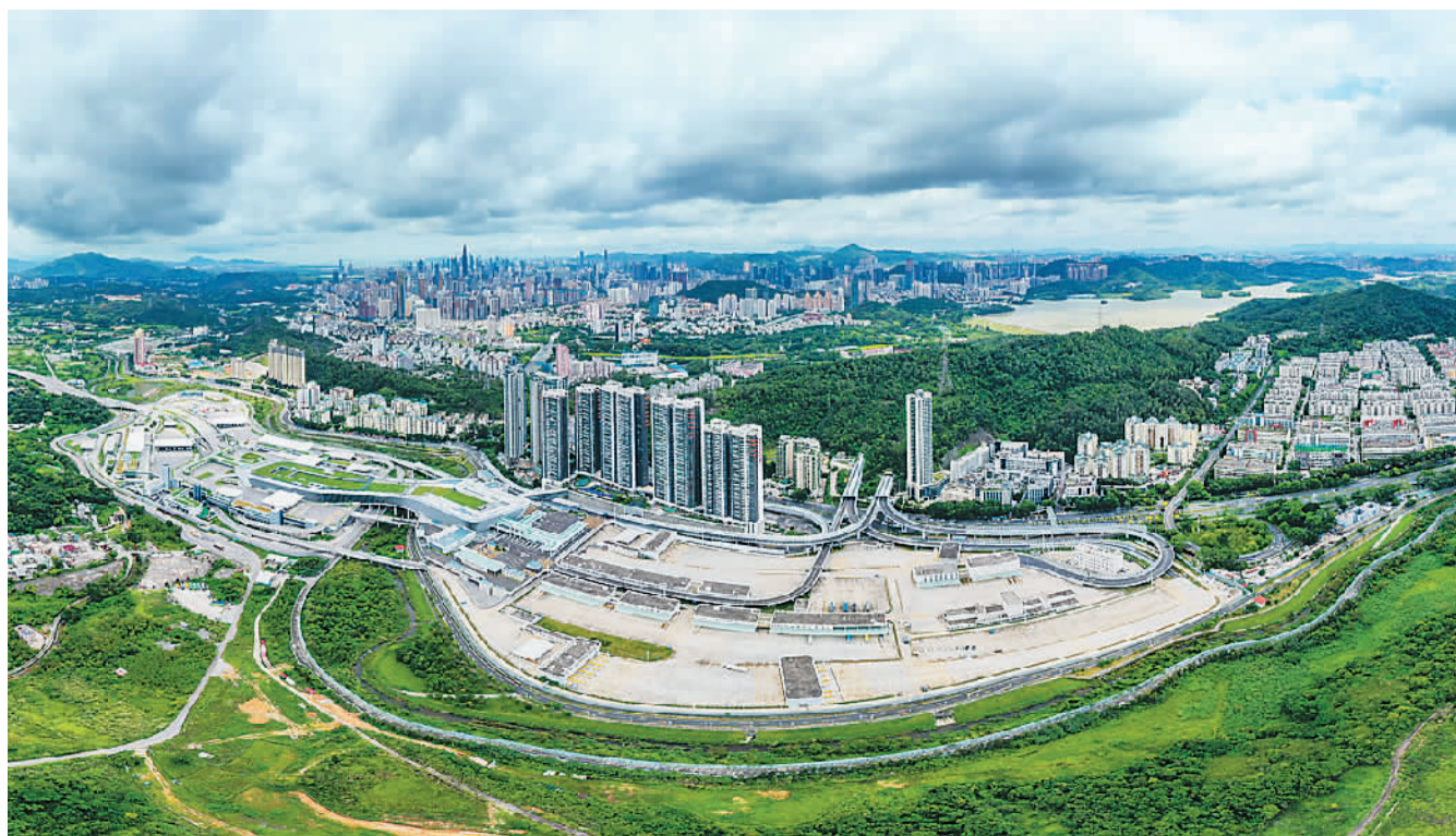
作为构筑深港跨境交通“东进东出、西进西出”大通关格局的重要一极,中铁四局承建的深圳东部过境高速公路目前建设进度已经过半。该跨境交通基础设施通车后将进一步畅通香港与内地人员物流往来,促进龙岗、坪山等深圳东部地区发展,为服务粤港澳大湾区建设提供一条新的“黄金通道”。图为深圳东部过境高速公路起于莲塘口岸。

据悉,此次研讨会由中国历史研究院指导,厦门大学主办,厦门大学台湾研究院承办,会期2天。两岸专家学者还将深入探讨郑成功收复台湾的历史进程、郑氏家族的海上活动、郑氏家族与台湾开发、郑成功与两岸历史记忆,以及郑成功收复台湾的现实启示、郑成功精神的时代意义等议题。