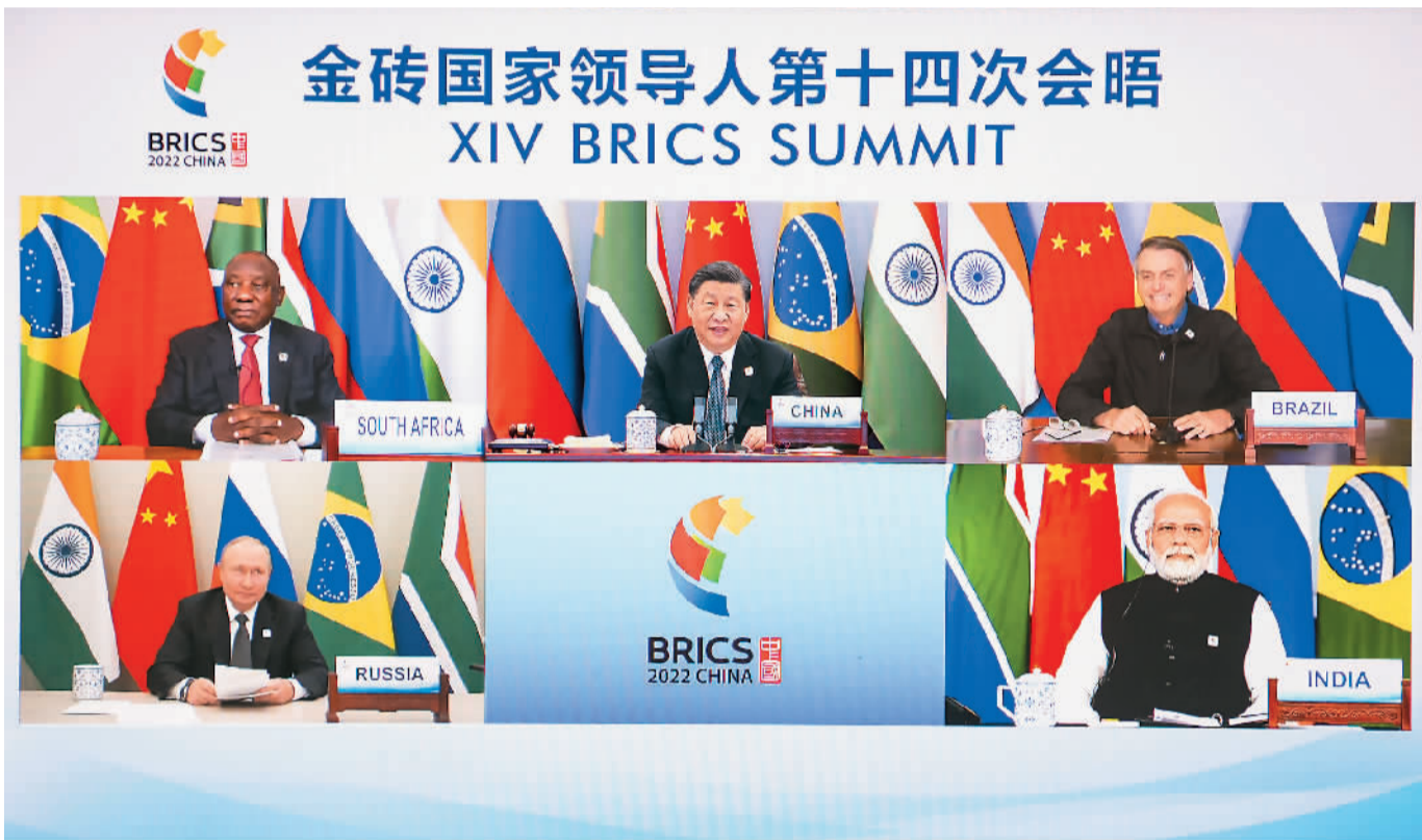
6月23日晚, 国家主席习近平在北京以视频方式主持金砖国家领导人第十四次会晤并发表题为《构建高质量伙伴关系 开启金砖合作新征程》的重要讲话。