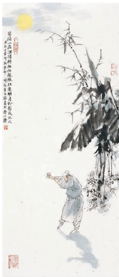
李白《月下独酌四首其一》诗意图(中国画) 王明明作