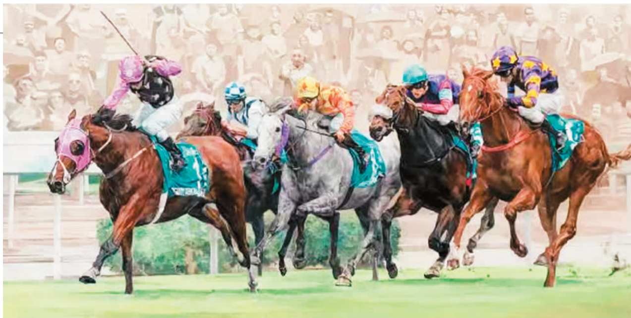
香港回归之马照跑(油画)

粤港澳三地地缘相近、文脉相亲。自香港、澳门回归祖国以来，内地与港澳的文化交流日益丰富。2019年，中共中央、国务院印发《粤港澳大湾区发展规划纲要》，提出“共建人文湾区”。粤港澳三地人文交流更加频密，逐渐形成了全方位、宽领域、多渠道的交流格局。美术也不例外。美术家们关注时代，观照现实，用情用力共绘粤港澳大湾区壮美画卷。