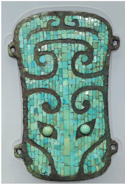
河南偃师二里头遗址出土的嵌绿松石铜牌饰。