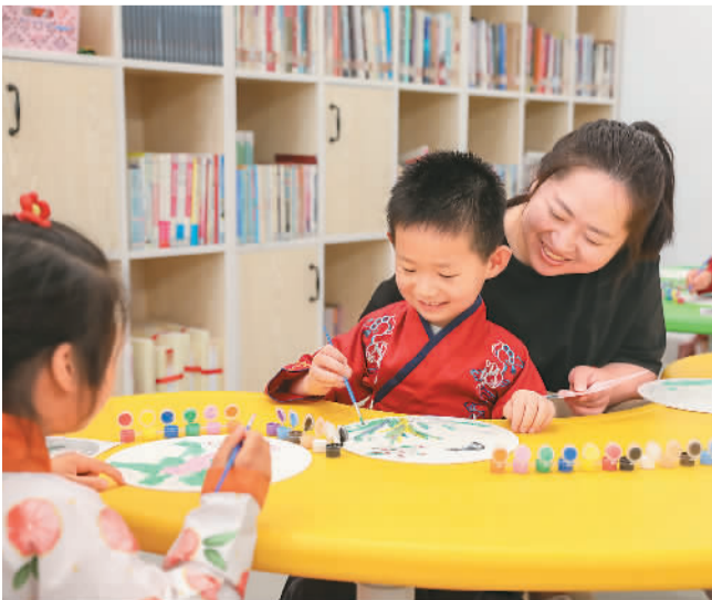
6月14日，浙江省湖州市德清县新市镇纪委、妇联共同开展“童心绘团扇，清风润夏至”活动，小朋友们身着汉服学习绘制团扇。