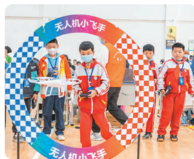
近日，贵州省毕节市首届青少年机器人竞赛举行。竞赛设置无人车挑战赛、无人车竞速赛、无人车编程挑战赛等。来自该市二百多名选手参与角逐。