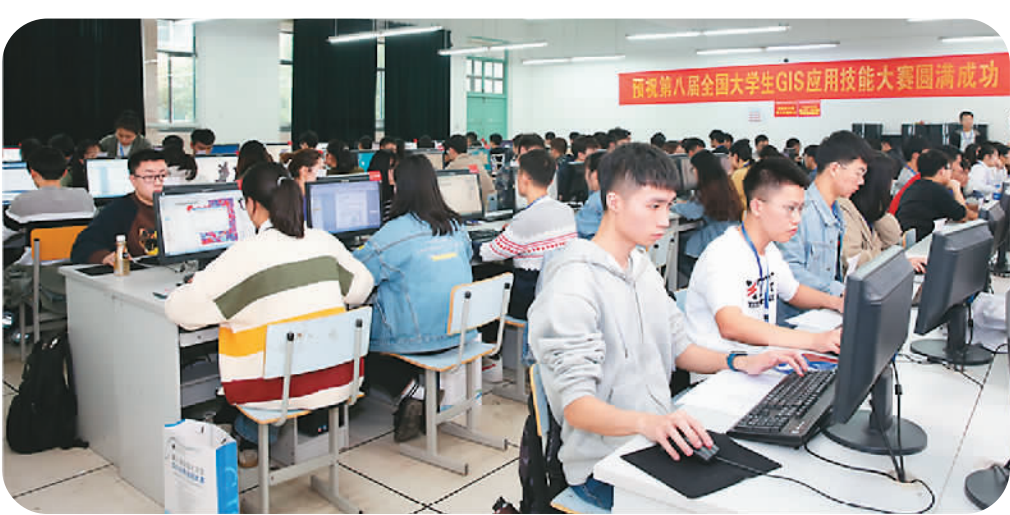
第八届全国大学生地理信息科学应用技能大赛现场。资料图片