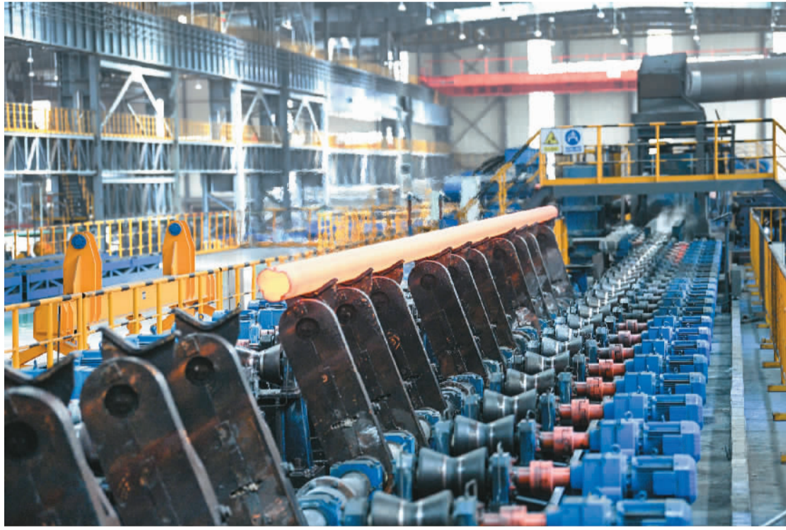
河北承德积极发展钕铁钆特种钢产业，引导特种钢制造智能化发展，实现特种钢材生产自动化把控，提升产品品质。图为承德建龙特殊钢有限公司无缝钢管厂生产车间。