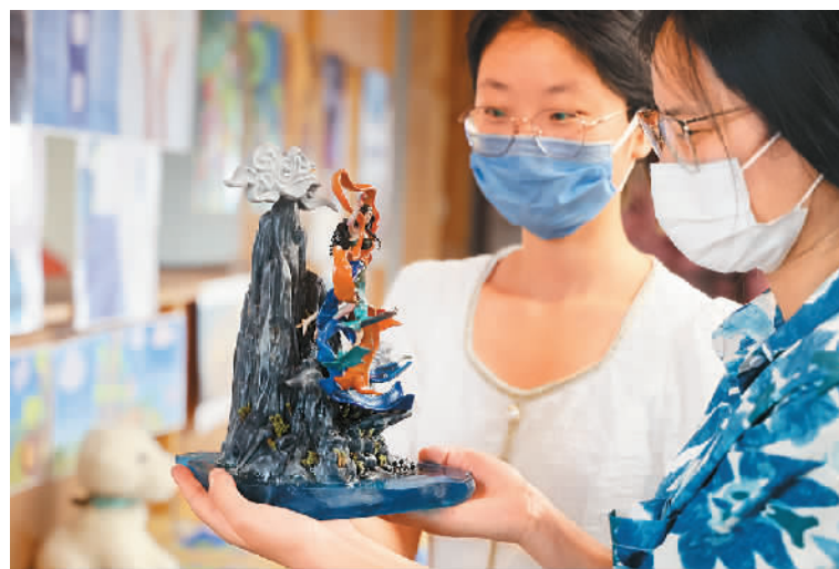
学生在“炫·青春”2022南通大学艺术学院毕业展上参观。