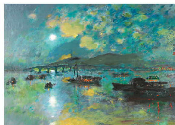
石湖赏月（油画） 颜文樑作

展览将二十四节气、苏州地区的时节文化、节日民俗活动与绘画艺术、古籍文献等融合在一起，展现一方水土所孕育的地域特色和人文气息，让观众沉浸式地感受艺术作品与传统艺术的融合之美。