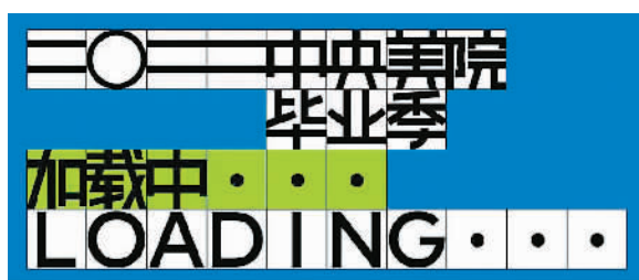
中央美术学院毕业季海报

学科的融合与跨媒介传播。学科的交流融合已经成为一种趋势。在打下扎实基础的前提下，学子们尝试跨学科创作，并借助新媒体传播，让作品获得更多关注。