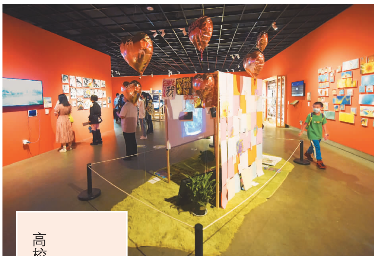
观众在浙江美术馆观看中国美术学院2022年毕业展上的作品。