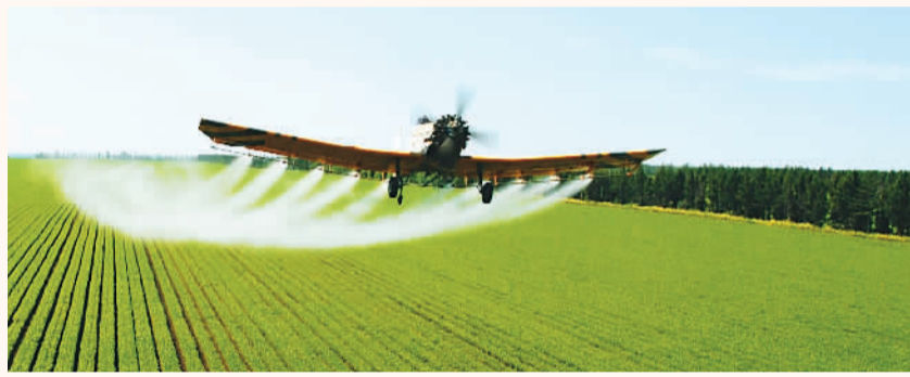
飞机执行农业航化作业任务