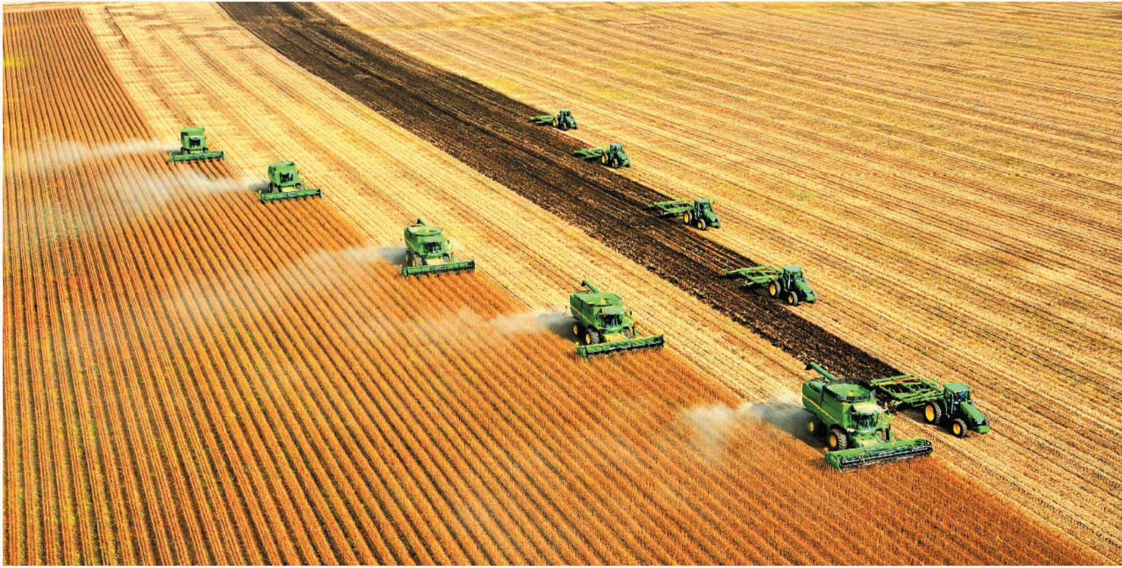
丰收时节的北大荒

是国家级生态示范区。下辖9个分公司、108个农（牧）场有限公司，978家国有及国有控股企业。2021年，北大荒农垦集团营业收入已超过1700亿元，为中国人端牢自己的饭碗作出了重大贡献。