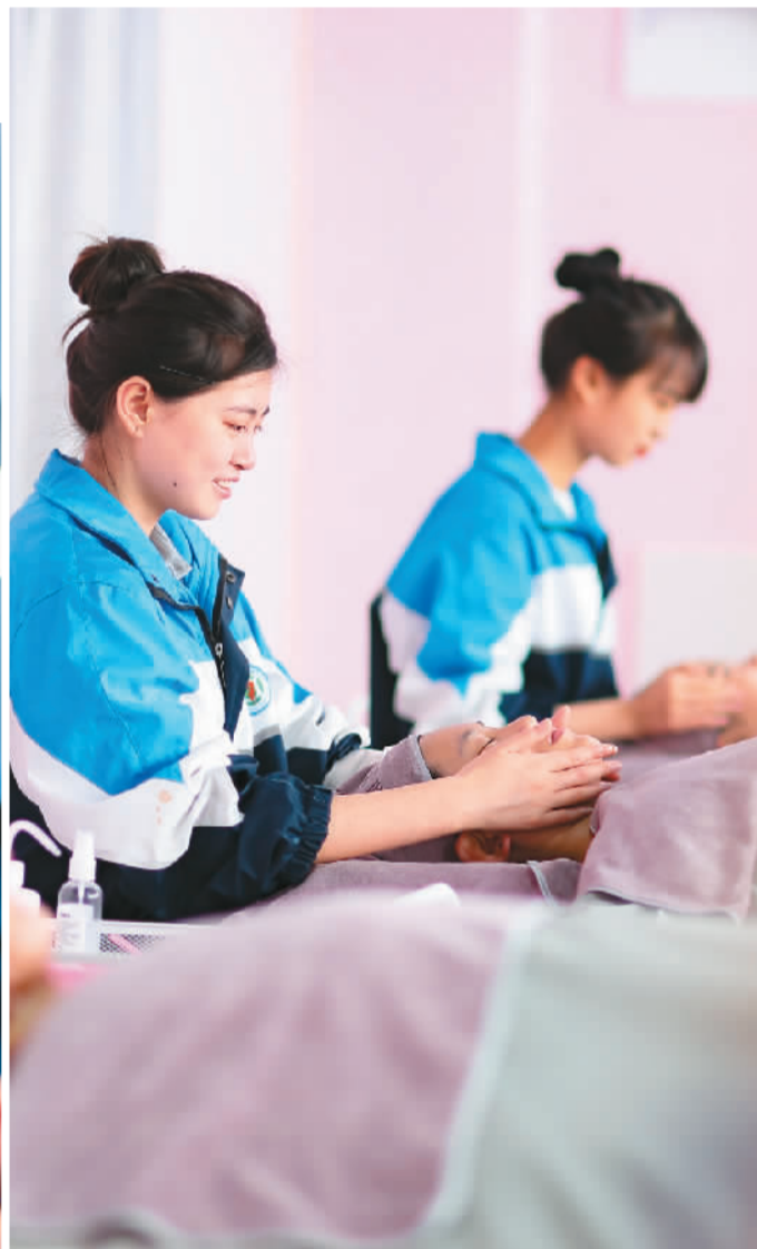
▲学生在贵州省铜仁市玉屏侗族自治县中等职业学校上美容美体课程。