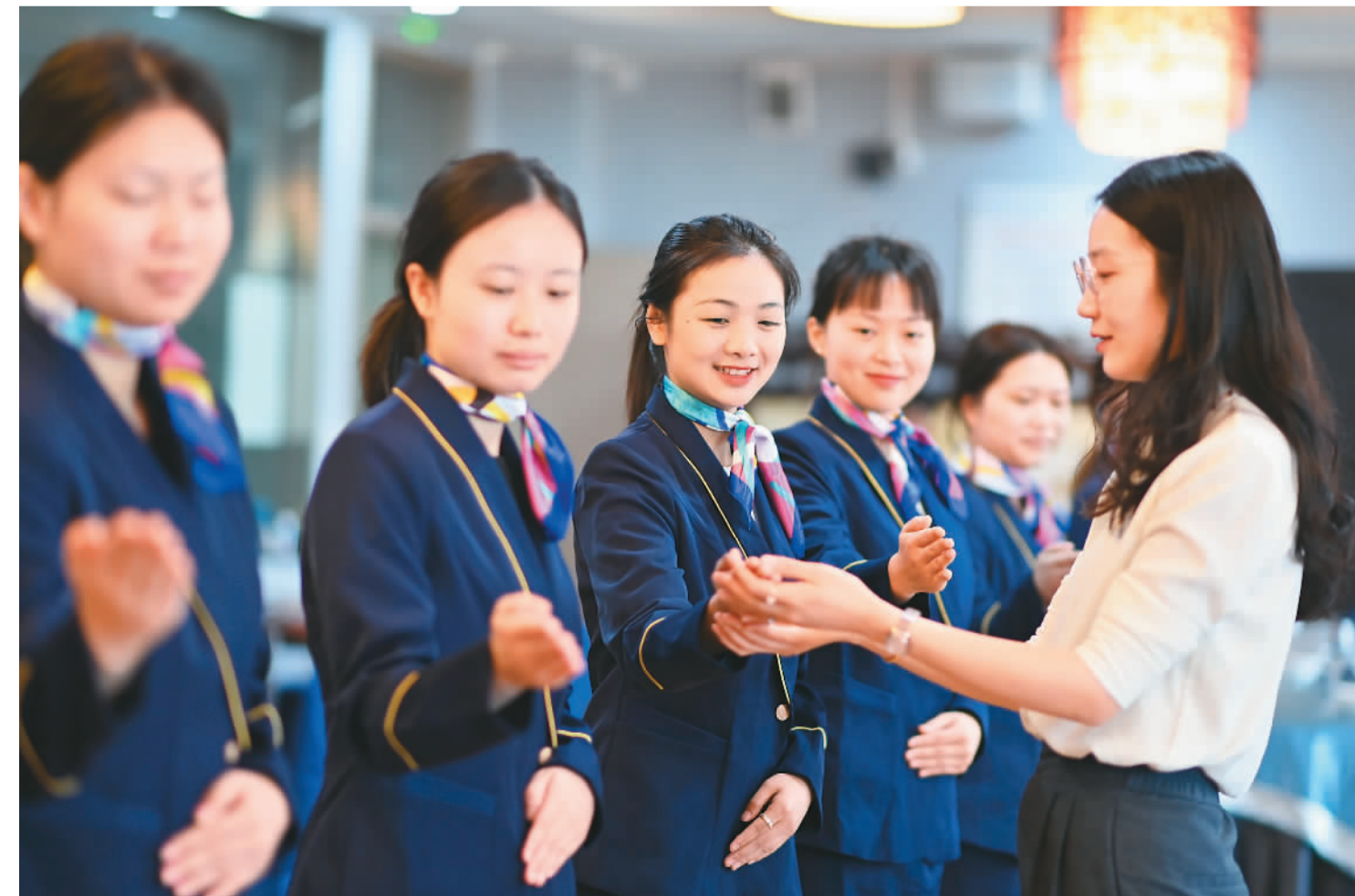
▲4月28日，在位于重庆市沙坪坝区大学城的重庆商务职业学院文化旅游学院，学生们正在上实训课。