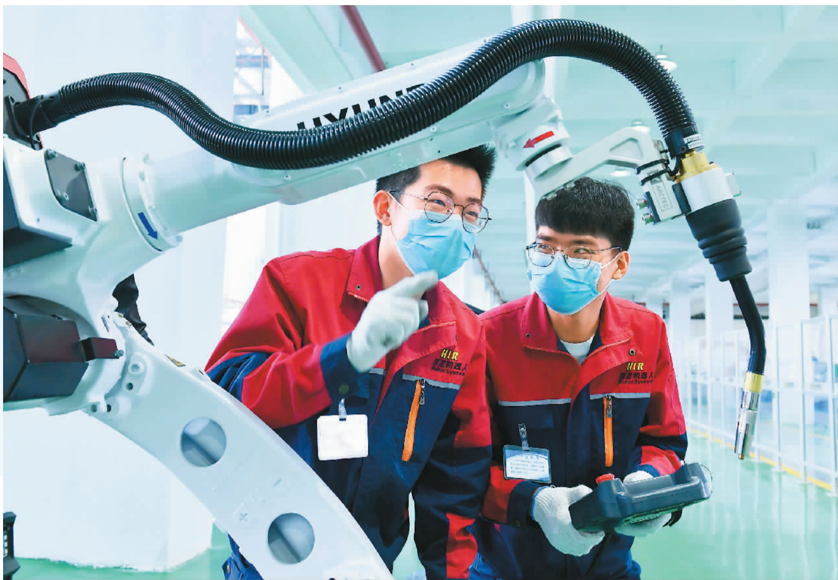
▶4月28日，河南省夏邑县孔祖中等专业学校学生在调试机器人。

日前正式施行的新职业教育法，首次以法律形式明确“职业教育是与普通教育具有同等重要地位的教育类型”。随着国家对职业教育的支持力度越来越大，全社会的成才观也在悄然变化，越来越多的年轻人通过接受职业教育，习得一技之长，成就着丰富多彩的人生。