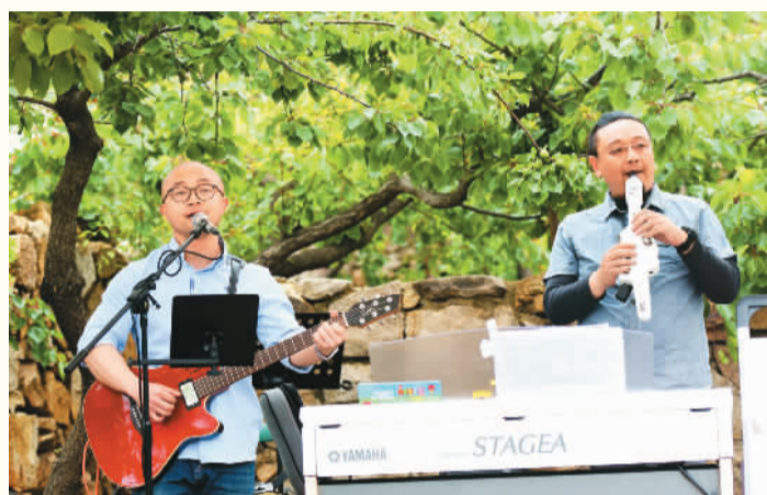
在山东省青岛市举办的一场“杏运市集”，以“简生活，探索乡村生活美学”为主题，将传统乡村与当代艺术结合。图为歌手在杏树下演唱民谣。