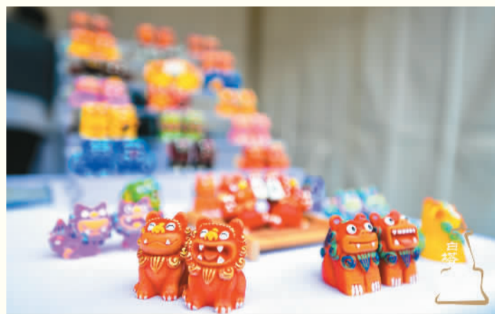
北京“白塔妙会”文创市集上展示的文创产品。

夜色慢慢暗下来，老街却更加流光溢彩。伴随着阵阵锣鼓声，一条昂头摆尾的彩龙劲舞开道，巨大的鲤鱼灯和众多的小鱼灯紧随其后，亮丽的灯光、斑斓的色彩、婉转的身形，以及此起彼伏的叫好声，瞬间将整条老街变成了欢乐的海洋。大家欢笑着、嬉闹着、簇拥着灯会的队伍，一路穿街过巷，来到老街尽头的廉夫桥上。原本寂静的徽水河立马热闹起来。桥上，鼓乐喧天，龙舟共舞，桥上，放河灯的人群摩肩接踵，争先恐后。一时间，龙灯、鱼灯、河灯，以及灿烂的烟花交相辉映，将老街的夜空和水面绘成一幅光影流动的巨画，也为我们的胡乐之旅做了完美的定格。