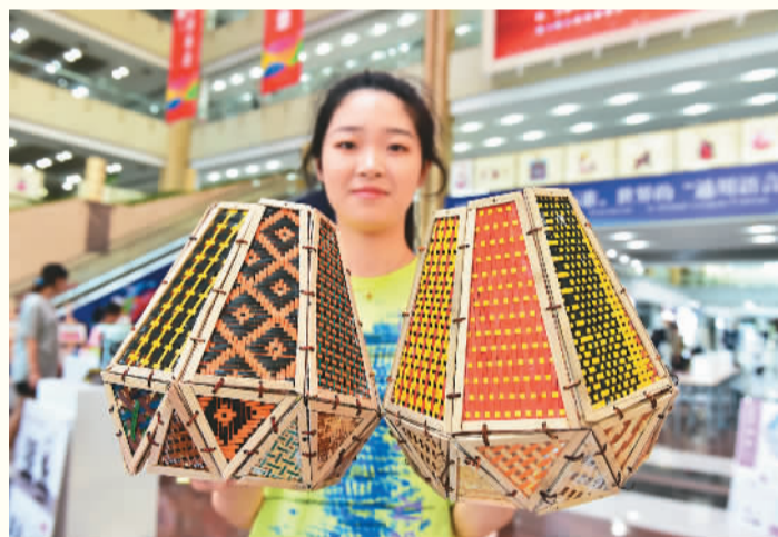
创意市集走进浙江省义乌国际商贸城。图为大学生展示环保竹编灯罩作品。