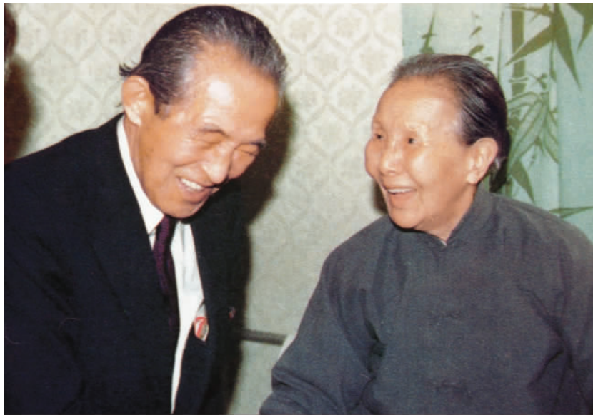
1980年，冰心（右）会见日本作家井上靖。

捷克斯洛伐克汉学奠基人普实克，在论文《中国新文学》中率先指出：冰心的诗“实际上是古老的艺术，古老的情感领域与富有创造性的方法之结合。”他的学生马塞拉·鲍什科娃不但翻译了冰心的短诗，而且还写有论文《冰心的短篇小说》和《中国现代韵律学的起源》。马利安·高利克是“布拉格汉学学派”的重要代表人物，他在论文《中国现代知识分子史研究之六：青年冰心》和《中国现代知识分子的典范——年轻的冰心、年老的泰戈尔与善良的牧者》中指出，冰心的诗作既有基督教的印记，又显示出佛教思想，但是冰心在思考关于神、个体、众生以及宇宙的关系时，仍然统一在中国传统哲学之中，这使得她对精神、理想和意识的表达更具直觉意会的特点，也因此，冰心的诗要比小说写得好。美国学者夏志清则提出了相反的观点。他在《中国现代小说史》中指出冰心的“诗和散文因缺乏现实的架构而倾向于感伤，但她的一些短篇小说具有独特的风格”。