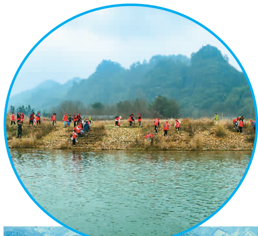
▲3月5日，湖南省怀化市通道侗族自治县万佛山镇，志愿者队伍在玉带河沿岸清理河滩垃圾。