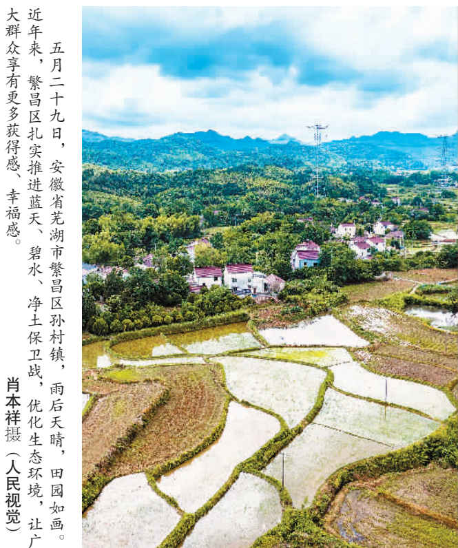
五月二十九日，安徽省芜湖市繁昌区孙村镇，雨后天晴，田园如画。近年来，繁昌区扎实推进蓝天、碧水、净土保卫战，优化生态环境，让广大群众享有更多获得感、幸福感。

如今，生态文明建设已纳入国家发展总体布局，建设美丽中国成为人民心向往之的奋斗目标。随着中国生态文明建设进入快车道，锦绣的中华大地必将拥抱更美丽的明天！