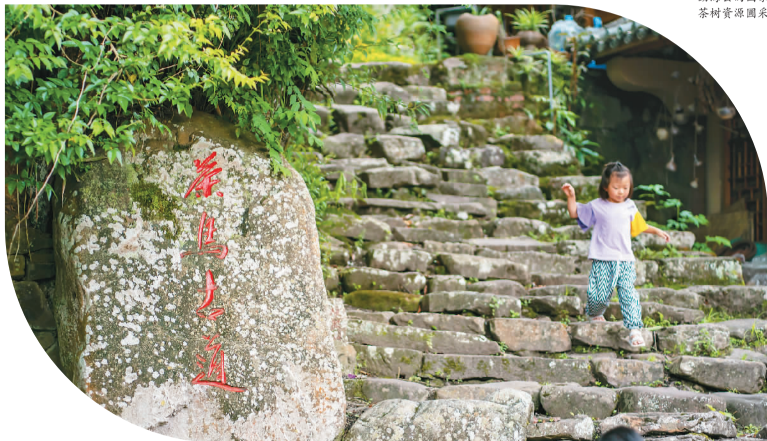
▲小朋友在云南省普洱哈尼族彝族自治县那柯里茶马古道小镇玩耍。