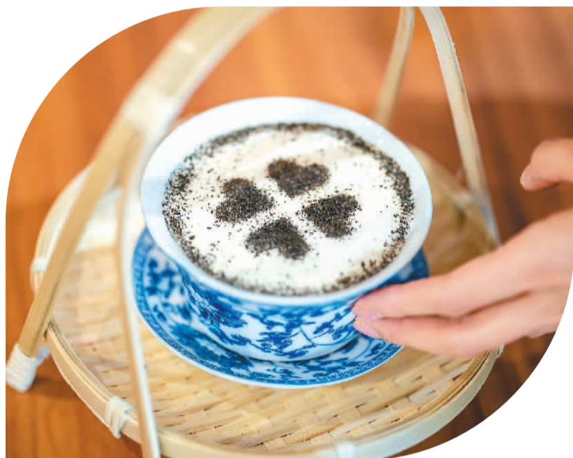
▲新型茶饮店里的创意茶饮品。