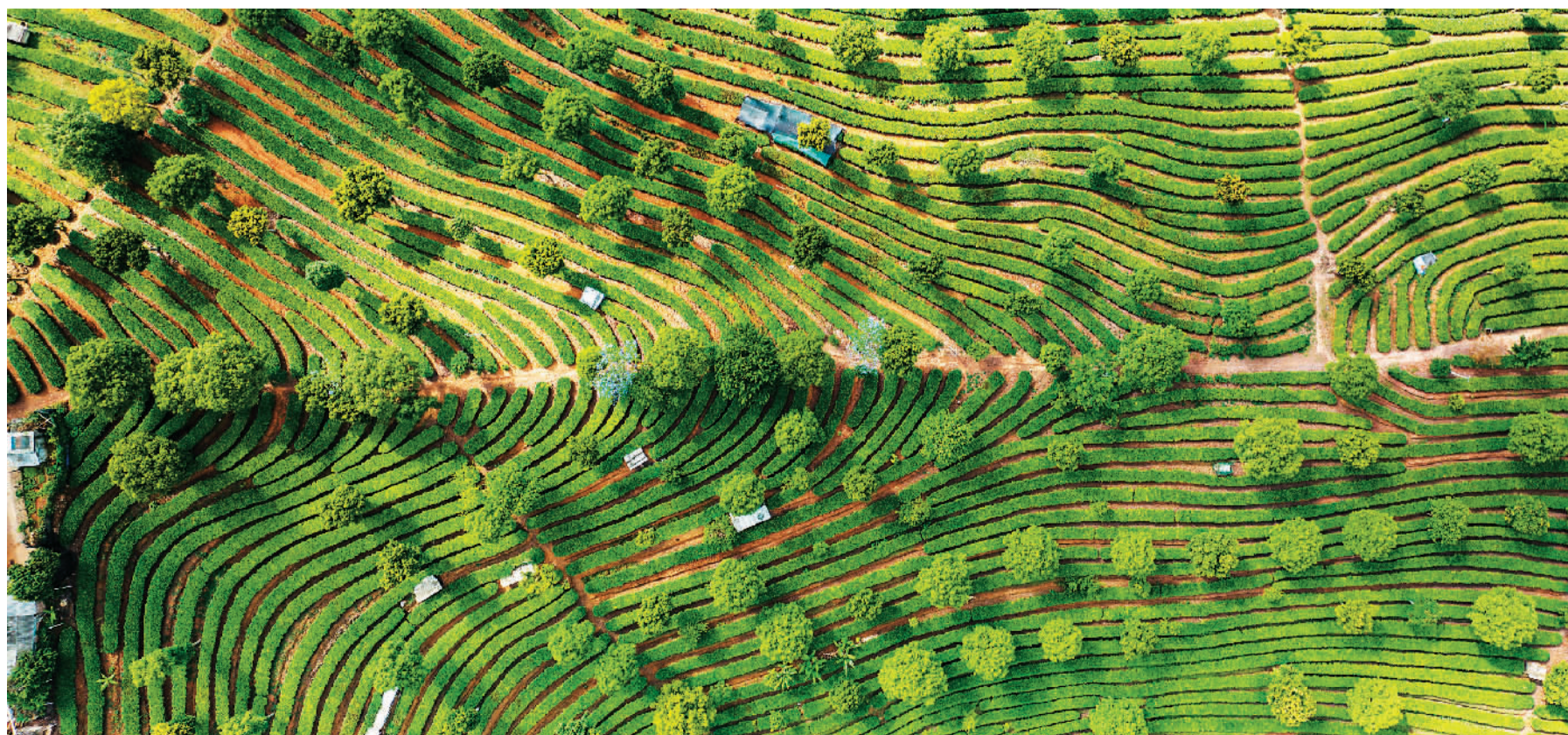
▲普洱市思茅区南屏镇整碗村的有机茶叶基地。