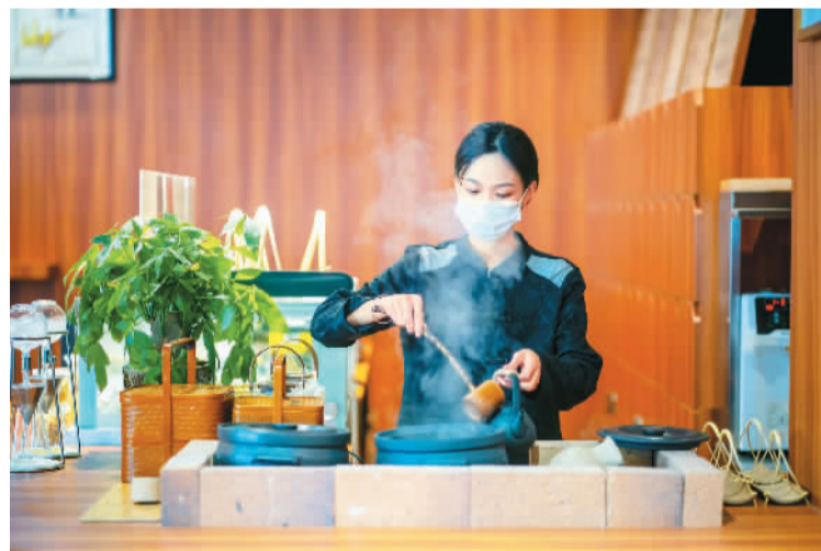
▲茶艺师在展示当地传统茶叶冲泡技术。