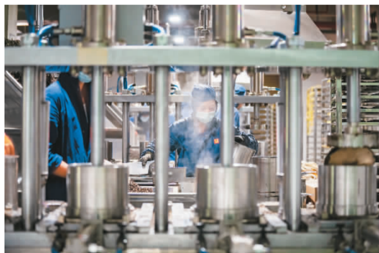
▲工人在西双版纳傣族自治州勐海县雨林古茶坊茶叶有限责任公司生产线上制作普洱茶。