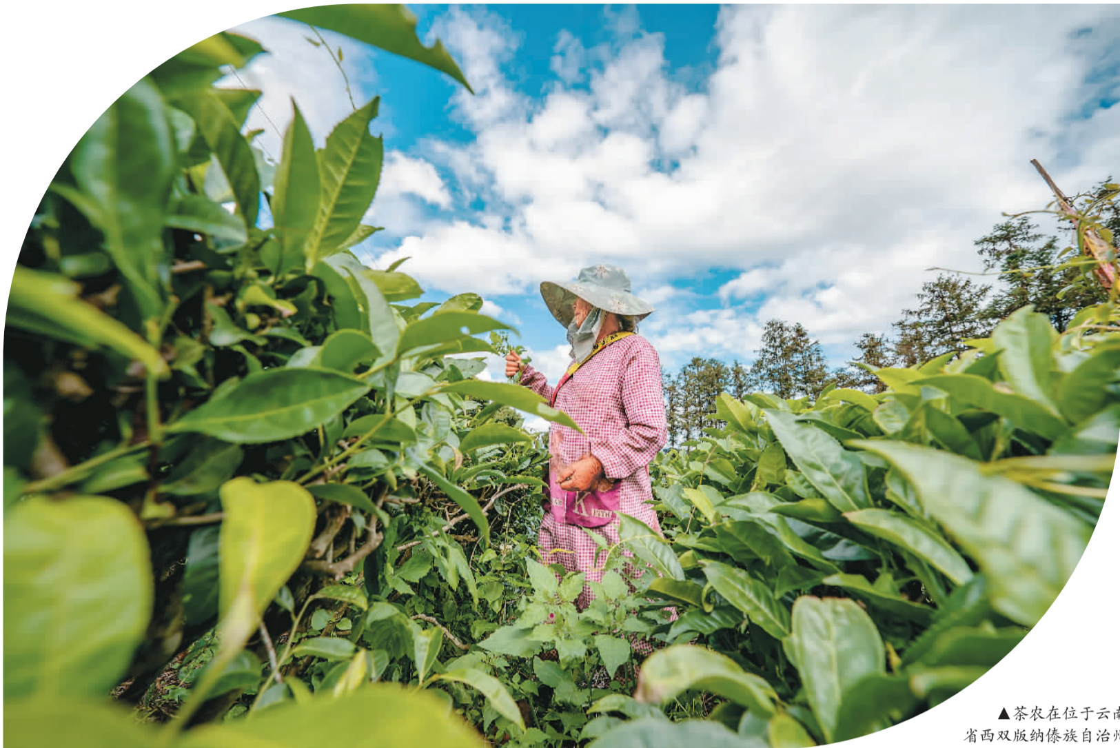
▲茶农在位于云南省西双版纳傣族自治州勐海县的国家种质大叶茶树资源圃采茶。

如今，漫步在一片片古茶林、有机茶园里，生态优先、绿色发展的故事俯拾即是，一幅茶文化、茶产业、茶科技统筹发展的边疆振兴新画卷徐徐展开。