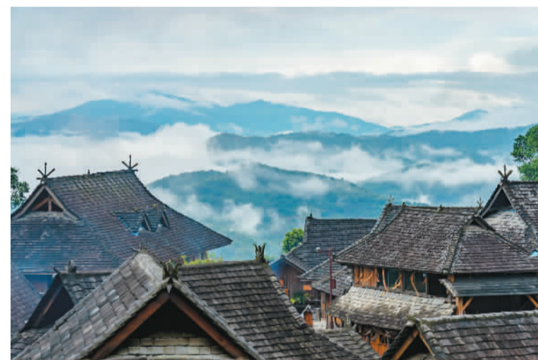
▲普洱市景迈山翁基古村落。