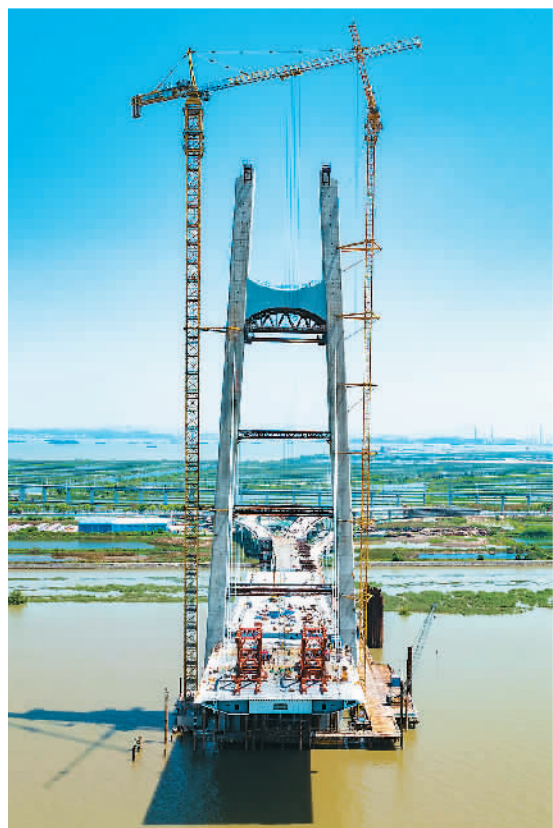
▲作为南沙自贸区重点交通基础设施项目，位于广州市南沙区万顷沙的红莲大桥建成后辐射带动广东全省形成更加高效便捷的现代交通运输体系。图为正在建设中的红莲大桥。