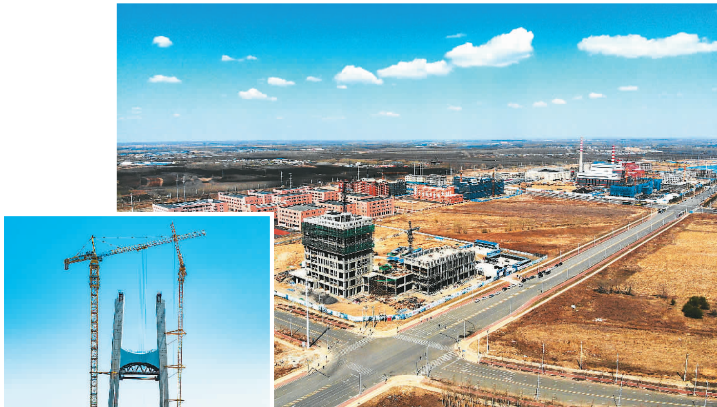
▲近日，中国（黑龙江）自由贸易试验区哈尔滨片区推进数字经济涉及的新材料、电子信息制造、软硬件服务三大产业集群化发展，努力实现数字经济转型发展。图为正在建设中的科发半导体产学研聚集区。

“近年来，以中国为第一大贸易伙伴的国家和地区不断增加，中国持续扩大的国内市场规模和扩大进口的努力使得许多国家对通过签订自贸协定与中国加强贸易关系抱有热情和兴趣。”崔凡说，“自贸协定的商签不仅扩大了我国对外贸易规模，还通过加强中国与自贸伙伴的产业链合作关系，推动了中国向全球价值链中高端的攀升，优化了对外贸易结构。”