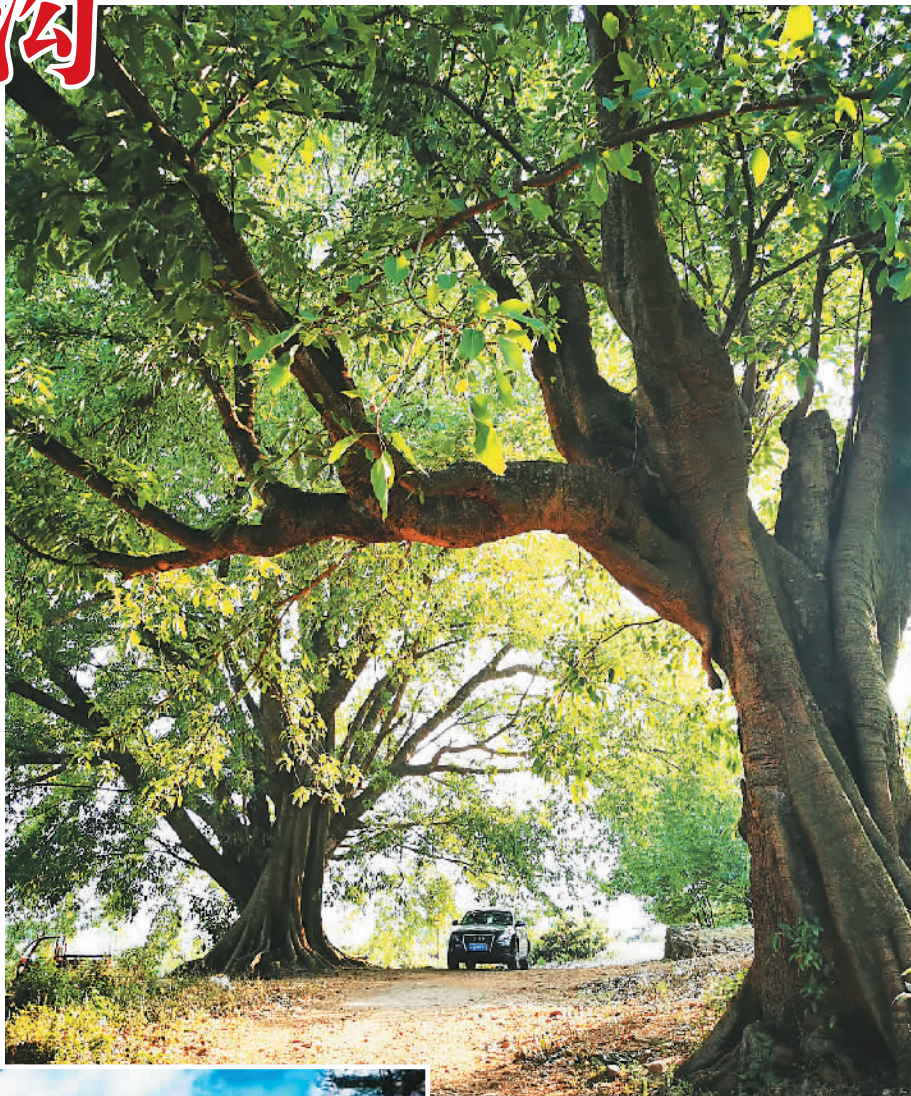
海花沟的参天古树。