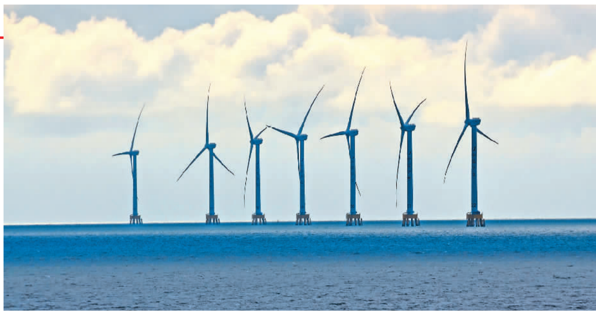
五月八日,在浙江省玉环市海环风电场,“风车”源源不断地输出清洁能源。