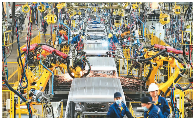
5月12日,在江西省赣州经开区,在山东凯马汽车制造有限公司赣州分公司冲焊车间,全自动机器人正在新能源汽车生产线上焊接作业。

线的问题的基础上,不仅实现了动力电池等电动汽车关键技术的突破,更借助于国内智能芯片企业产品研发快、与用户紧密联系等优势,在高等级自动驾驶领域成功实现“弯道超车”“换道超车”。此外,中国消费者对电动汽车的需求也是不容忽视的因素:得益于各大互联网企业对消费者活跃多诉求的及时响应,中国自主品牌为满足消费者对电动汽车多元化的需求而纷纷聚焦不同细分领域,研发出各种多样化、多功能的产品。