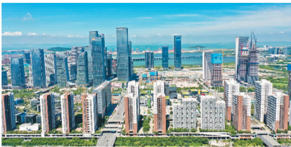
近年来，深圳前海成为许多港澳青年在粤港澳大湾区内地城市就业创业的第一站。图为前海合作区建设风貌。

随着“大湾区青年就业计划”等一系列支持措施的落地实施，越来越多的港澳青年将登上大湾区的“大舞台”，在这里实现梦想。