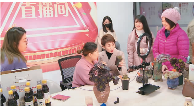
在“台商走电商”实践中，宿迁市举办台湾青年电子商务培训班，培训班老师现场指导直播带货，提升台青实践能力。

2022“台商走电商”启动5周年暨两岸融合发展（宿迁）“云交流”活动近日在江苏省宿迁市举行。活动以视频连线方式举行，在宿迁设立主会场，同时在北京、上海、台北、台中等地设18个分会场。活动达成签约项目22个，协议总投资133.85亿元，涉及电子信息、智能制造、新型