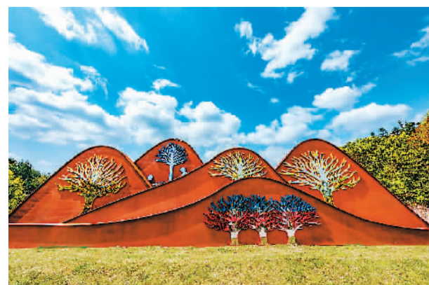
▲ 大型雕塑《江山多娇》