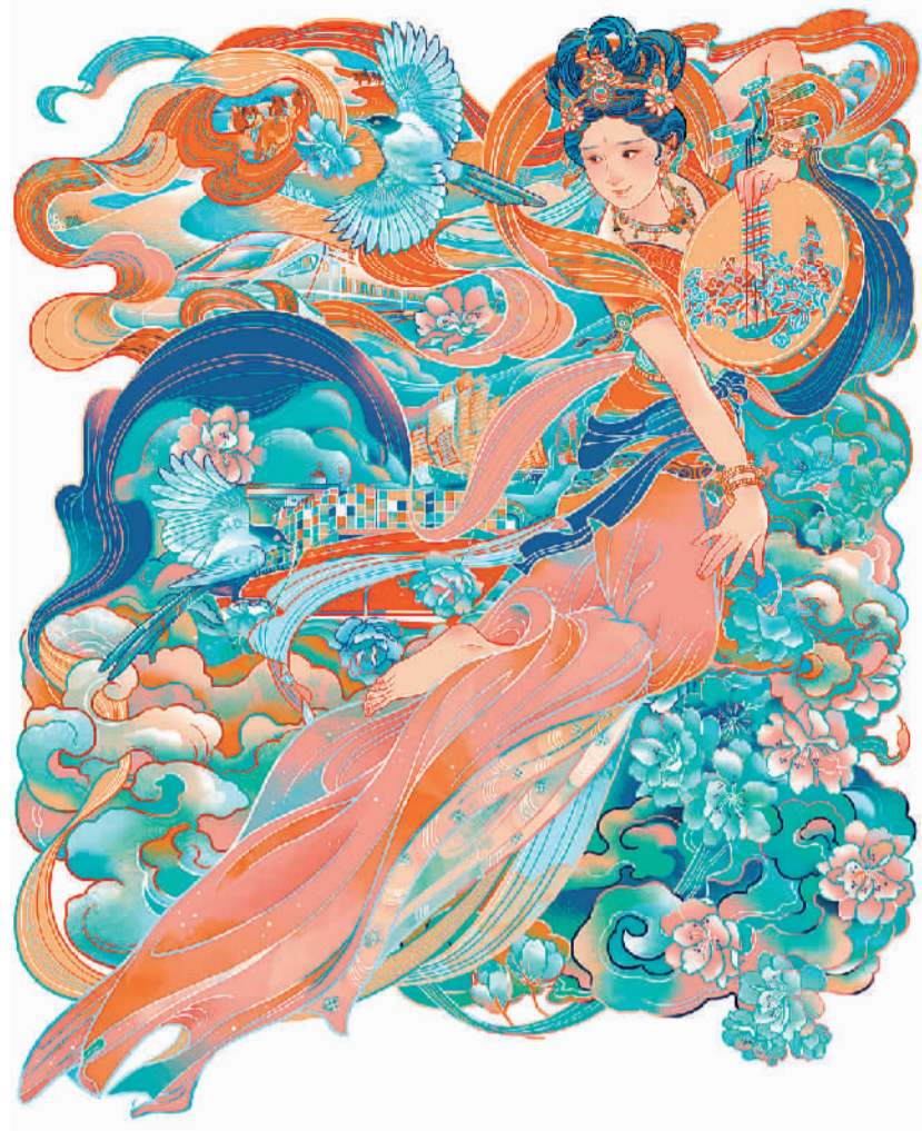
▲ 丝路新语 李旻