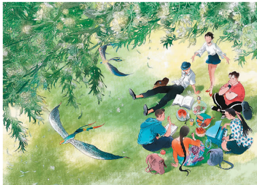
▲ 夏日青年说 阿梗