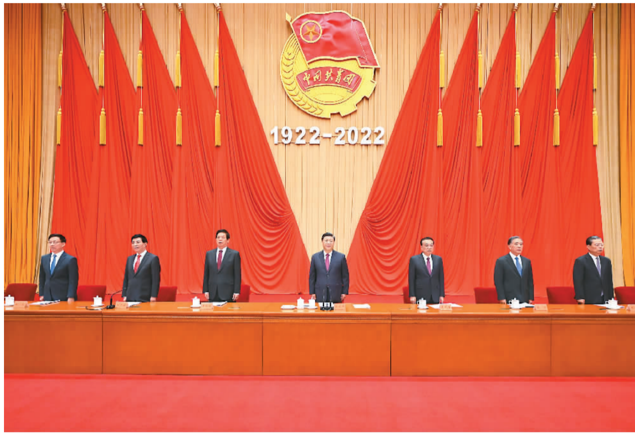
5月10日,庆祝中国共产主义青年团成立100周年大会在北京人民大会堂隆重举行。习近平、李克强、栗战书、汪洋、王沪宁、赵乐际、韩正等出席大会。

新华社北京5月10日电 庆祝中国共产主义青年团成立100周年大会10日上午在北京人民大会堂隆重举行。中共中央总书记、国家主席、中央军委主席习近平在会上发表重要讲话强调,青春孕育无限希望,青年创造美好明天。新时代的中国青年,生逢其时、重任在肩,施展才干的舞台无比广阔,实现梦想的前景无比光明。实现中国梦是一场历史接力赛,当代青年要在实现民族复兴的赛道上奋勇争先。共青团要牢牢掌握培养社会主义建设者和接班人的根本任务,坚持为党育人、自觉担当尽责、心系广大青年、勇于自我革命,团结带领广大团员青年成长为有理想、敢担当、能吃苦、肯奋斗的新时代好青年,用青春的能动力和创造力激荡起民族复兴的澎湃春潮,用青春的智慧和汗水打拼出一个更加美好的中国。