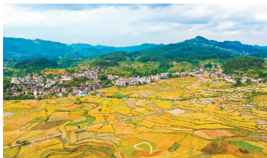
5月8日,贵州省贵阳市开阳县禾丰乡马头村底窝坝彩色斑斓。从空中俯瞰,金黄的油菜与阡陌田园、绿水青山、秀美村庄相映成趣。

2013年,党的十八届二中全会提出改革工商登记制度,开启商事制度改革序幕。此后“三证合一”“五证合一”“多证合一”逐渐在全国