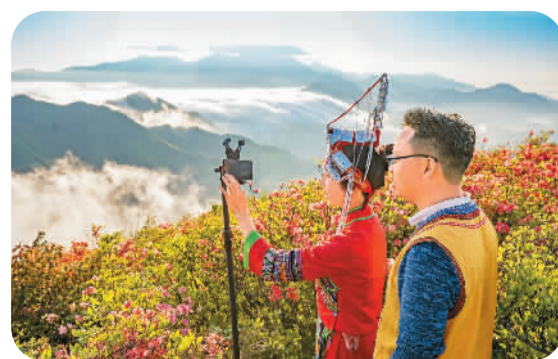
安徽省宁国市云梯乡畲族村民在汤公山直播云海和杜鹃花。

在建水很多地方，游客都可以参与拉坯体验，见证陶泥成形的过程。拉坯机飞速旋转的同时，湿润的陶泥在双手的抚摸下，温柔乖巧，顺从地随着双手一边旋转，一边慢慢升高、延展、合拢、弯曲，按照自己的想法拉成杯子、碟子、碗等各种造型，最后，还可画上自己喜欢的图案或写上有纪念意义的字。