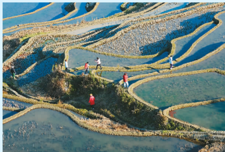
云南省红河哈尼族彝族自治州元阳县新街镇爱春村，游客在梯田里游览。

保护细则的绑定，村子实实在在有了改变：村民们真金白银的分红收入多了，潜移默化内生动力增加了，游客们的旅游体验提升了。阿者科村为乡村振兴、传统村落和梯田文化遗产保护，找到了一条可持续发展的旅游发展之路。