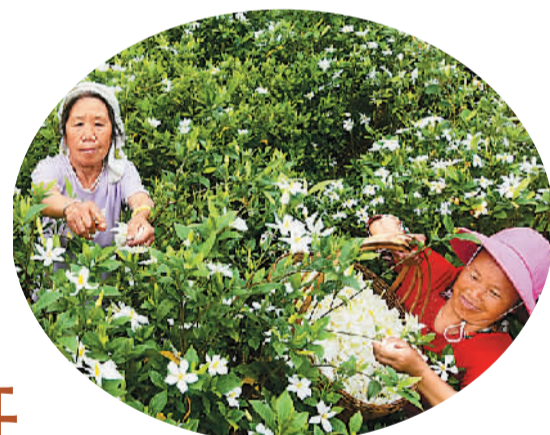
湖南省郴州市嘉禾县村民在采摘栀子花上市。

梯田高耸云烟里，风情人家半山中。在畲乡期间，我们还游览了千秋关古战场遗址、大野洼、花溪谷、太子坑水库、将军关漂流等景点。可谓移步皆是美景，入耳尽有传说。作为位处天目山西北麓、安徽省唯一的一个畲族乡镇，它的确有辜负每一个到来者的期待。