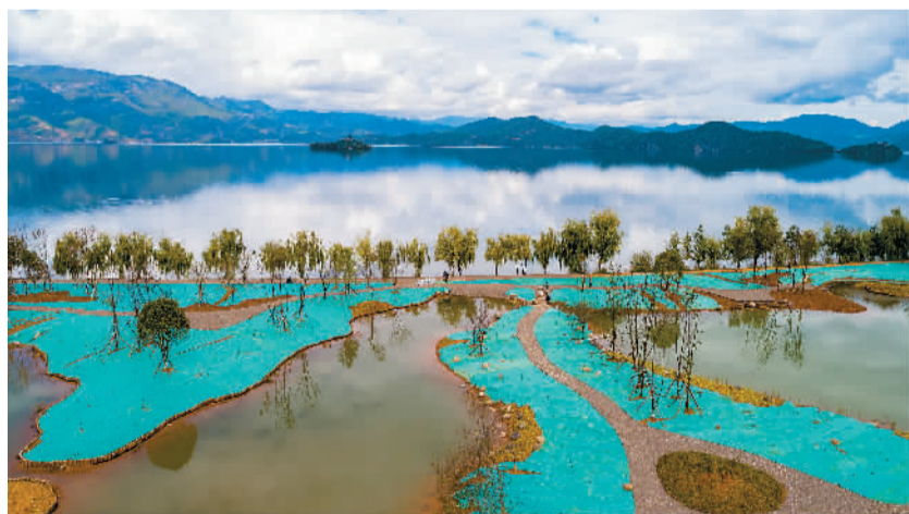
泸沽湖边一处正在建设的湖滨湿地。

随着年龄增长，越发喜欢起朴实的事物，比如竹编家具、原木桌椅、粗布坐垫，它们和阳台上的栀子花一样，折射着自然之物给生活带来的特殊质感。轻风抚过，花香淡淡，望着茶香缭绕的热气，我忽然明白，褪尽铅华，回归本真，守着清浅细碎的寻常时光，享受栀子花般素雅清淡却芬芳馥郁的日子，才是世间最安稳恬淡的幸福！