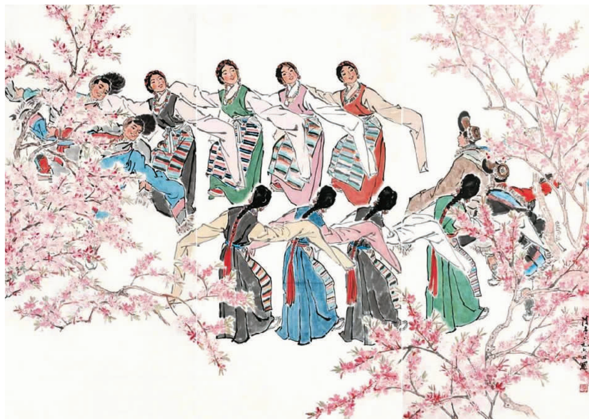
高原之春（中国画） 叶浅予

回顾百年来民族题材美术创作的辉煌画卷：从庞薰莱的《贵州山民图》，到叶浅予的《中华民族大团结》；从詹建俊的《高原的歌》，到坐落于中国共产党历史展览馆广场、由鲁迅美术学院创作的大型汉白玉雕塑《追梦》……民族题材美术作品一直是中国现当代美术史上不可或缺的重要篇章，凝聚着不同时代艺术家的民族情怀与时代关切，生动诠释着各民族“像石榴籽一样紧紧抱在一起”。