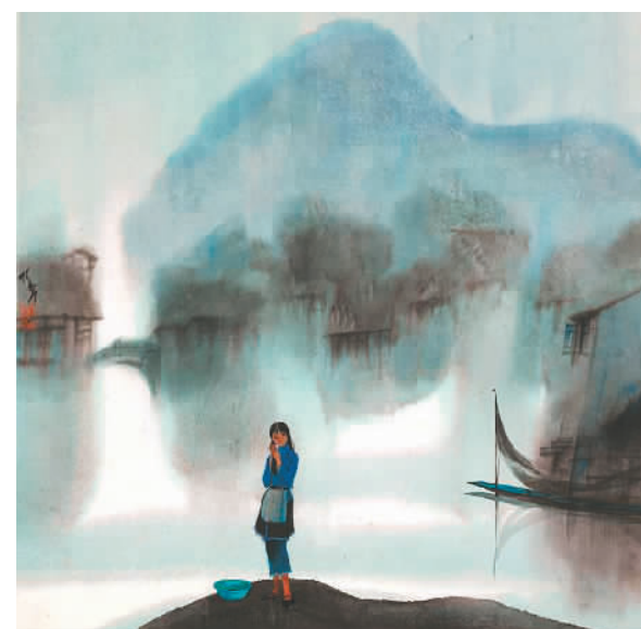
江南晨雾（中国画） 杨明义

中国美术馆馆长吴为山认为，申世辉的山水画给人一种云山苍茫之意。这源于他在深入生活过程中的观察体验，也源于他对传统笔墨的深入研究，在领会、领悟过程中的深刻理解和融合。