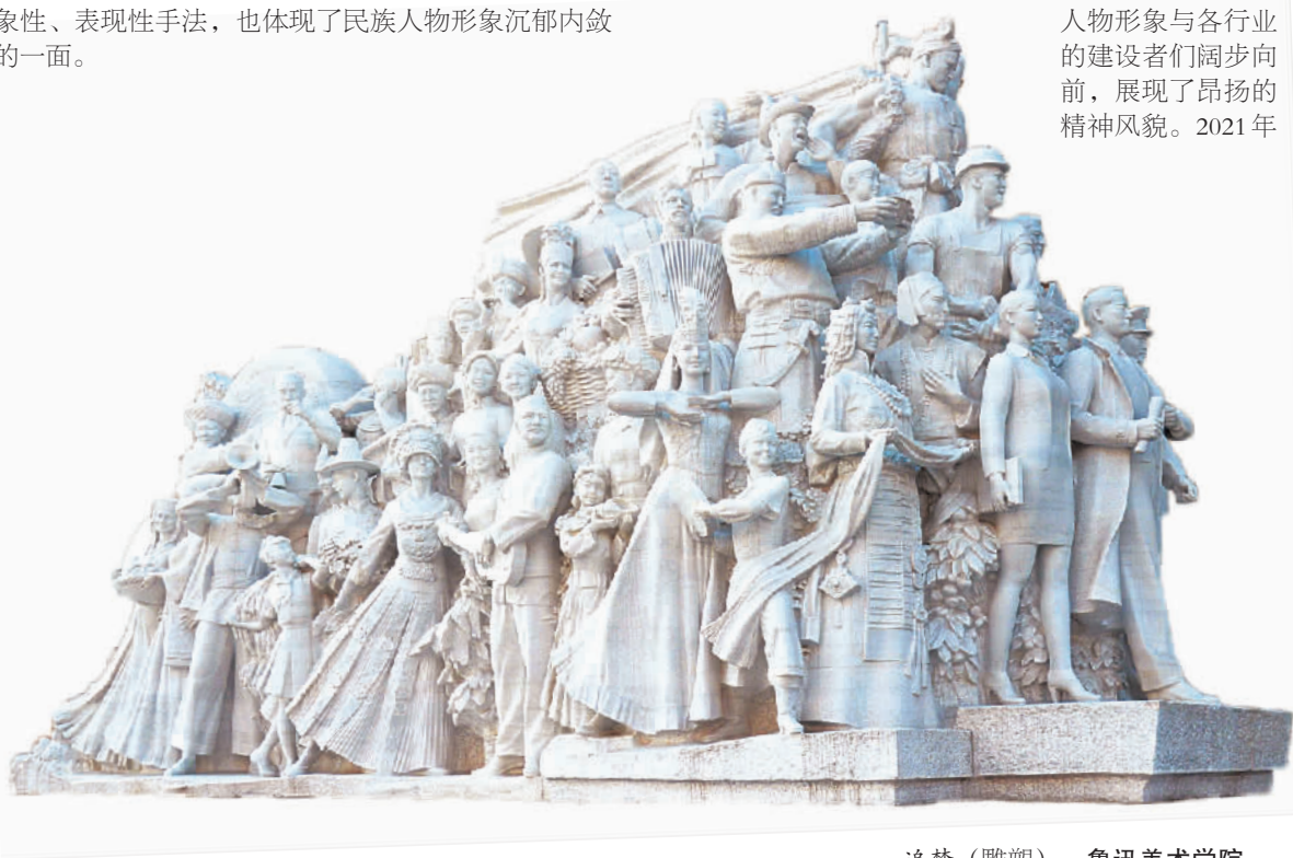
追梦（雕塑） 鲁迅美术学院

2016年1月，由鲁迅美术学院师生集体创作的大型铸铜组雕《旗帜》落成于中央党校综合教学楼前广场。这件作品体量巨大，高13.7米，长20.8米，最宽处为11.1米，人物平均高度4米。迎风招展的鲜艳党旗下，56个民族的人物形象与各行各业的建设者们阔步向前，展现了昂扬的精神风貌。2021年