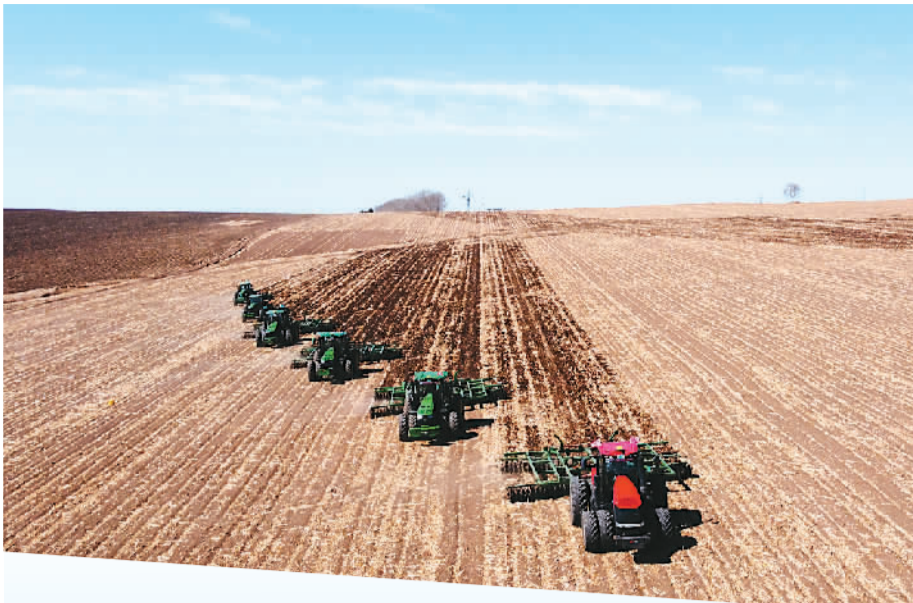
4月7日，内蒙古自治区呼伦贝尔市，一名农用手驾驶农机进行田间作业。