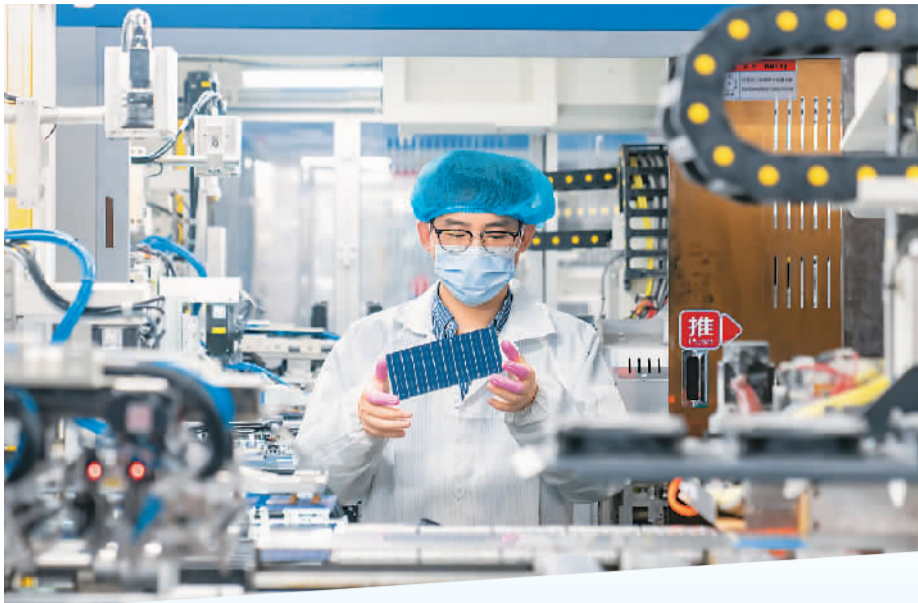
4月18日，江苏省海安市一家新能源科技公司车间内，工人们正在赶制出口太阳能光伏组件。