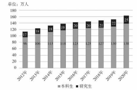
图3 2012年至2020年中国高等学校工科专业本科、研究生毕业生数