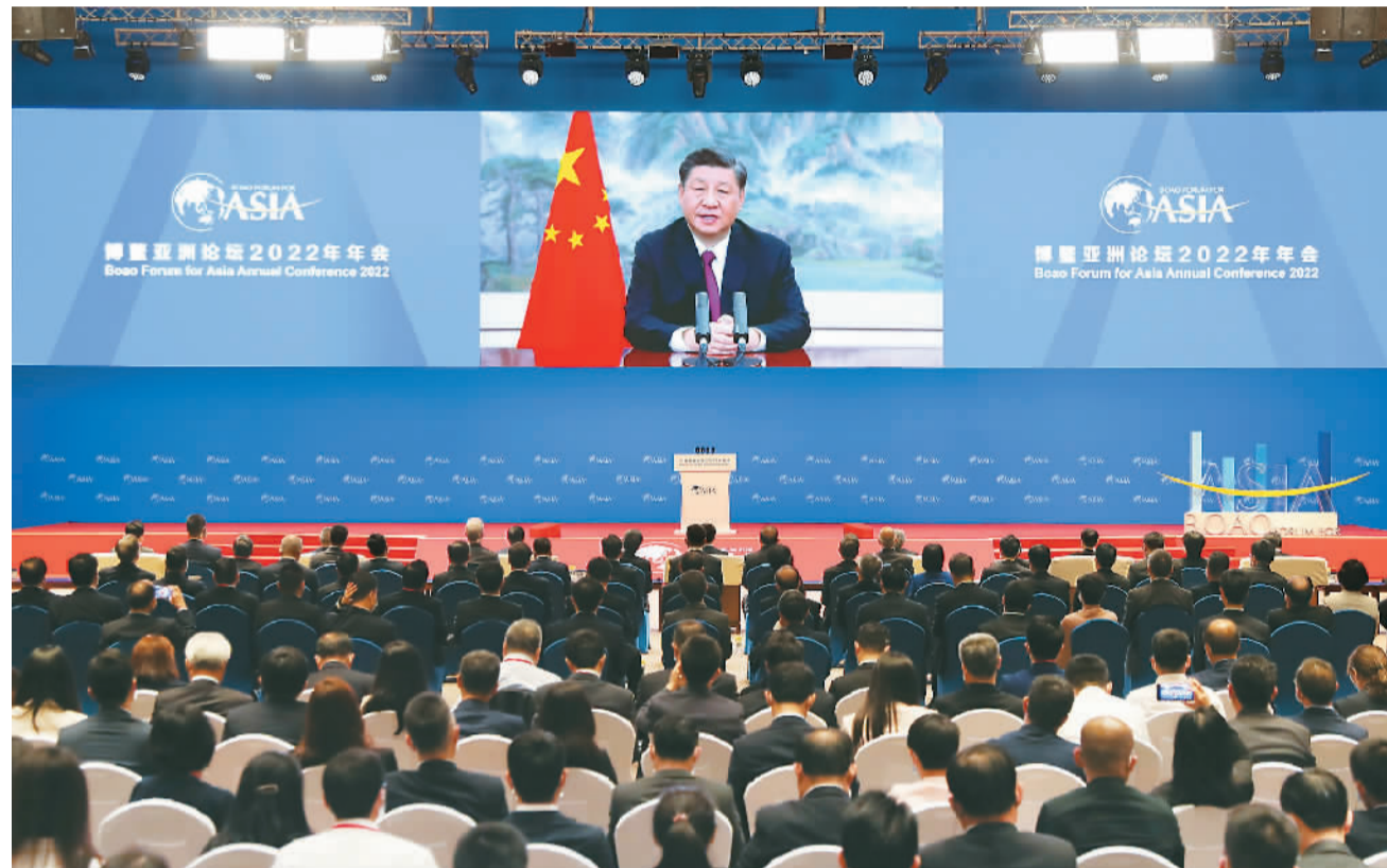
4月21日上午,博鳌亚洲论坛2022年年会开幕式在海南博鳌举行,国家主席习近平以视频方式发表题为《携手迎接挑战,合作开创未来》的主旨演讲。

新华社北京4月21日电 博鳌亚洲论坛2022年年会开幕式21日上午在海南博鳌举行,国家主席习近平以视频方式发表题为《携手迎接挑战,合作开创未来》的主旨演讲。(演讲全文见第二版)