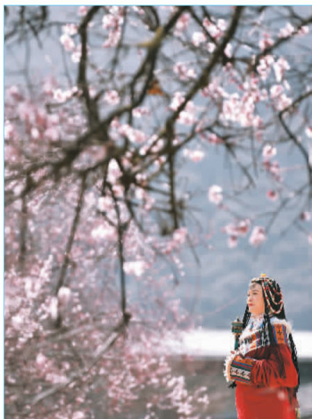
林芝的春天，漫山遍野桃花盛开。

“生态是林芝的最大资源、最大优势和最亮丽底色。推进绿色低碳发展，我们有潜力更有优势。”在刚刚过去的全国两会上，全国政协委员、林芝市委书记刘