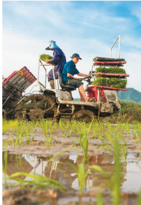
江西省九江市都昌县蔡岭镇杨湾村农民驾驶农机在田间劳作。