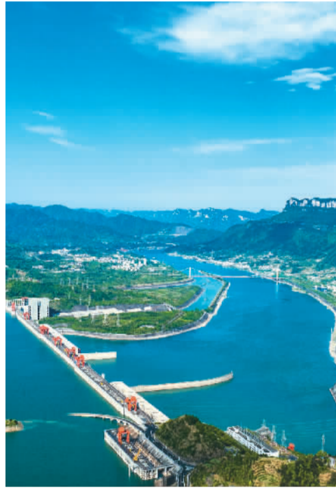
长江三峡枢纽工程稳健运行。