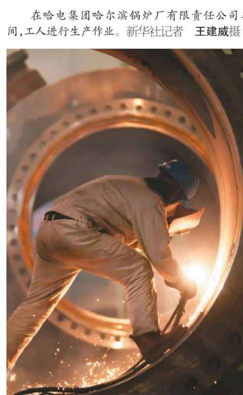
在哈电集团哈尔滨锅炉厂有限责任公司车间,工人进行生产作业。