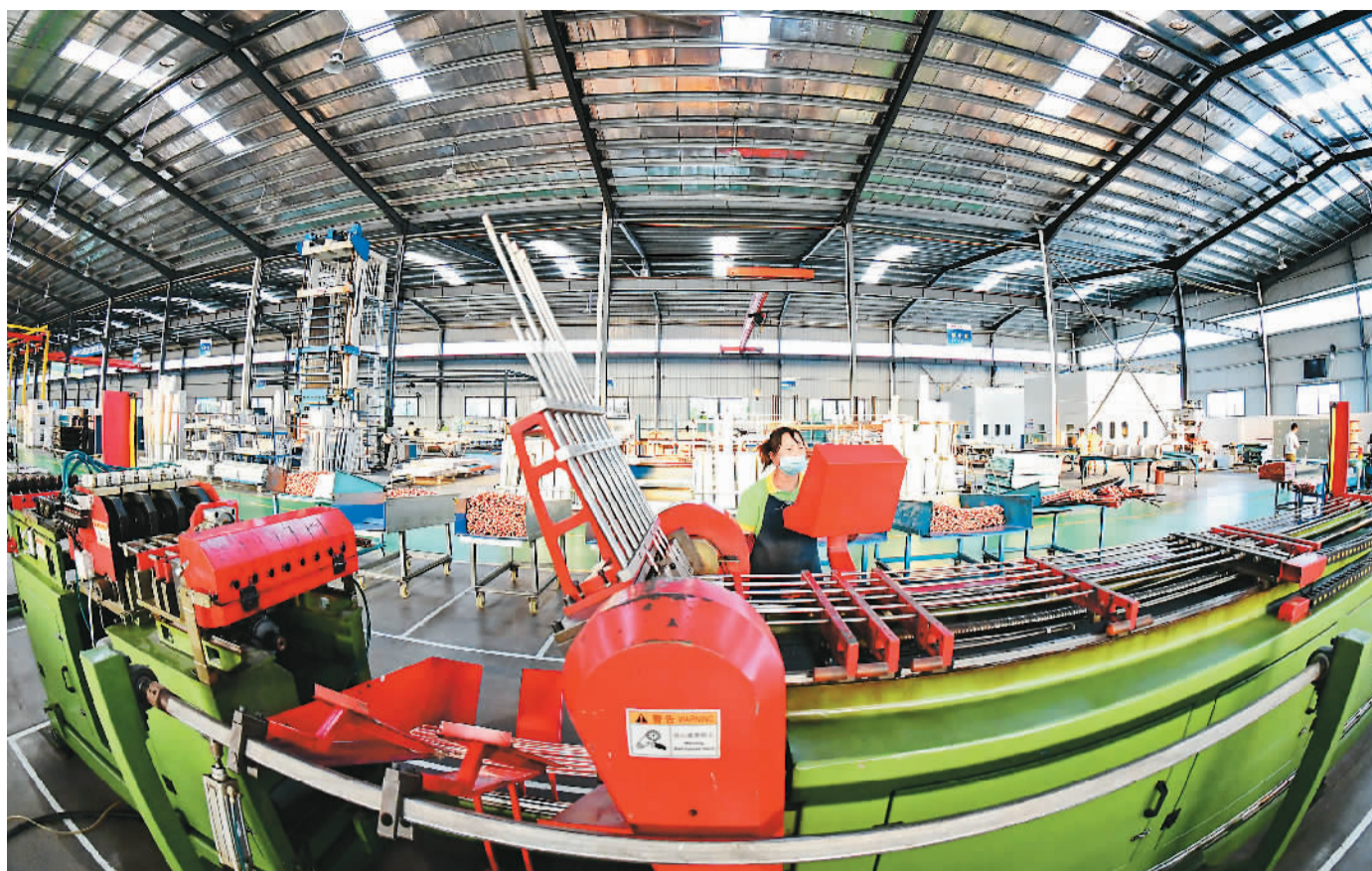
▲ 4月11日，江西省赣州市赣县区的一家环境科技企业内，工人在生产线上忙着赶制出口的智能中央空调零部件。