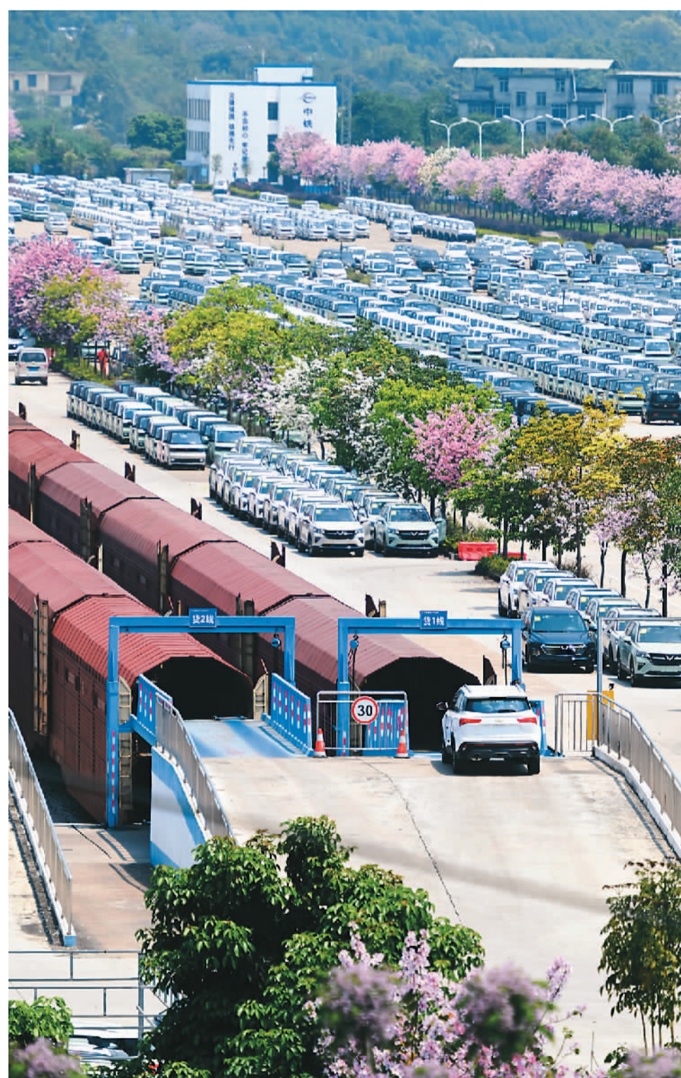
▲ 4月11日，在广西壮族自治区柳州市雅容商品汽车物流基地，出口中东国家的汽车在被转运到火车车厢。