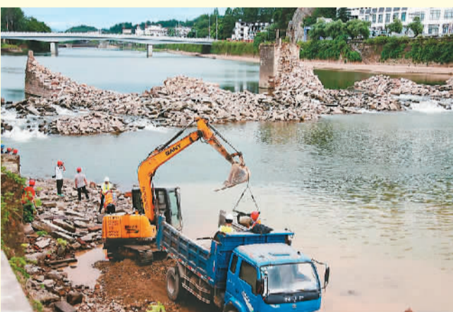
2020年8月12日，镇海桥散落构件、石料的打捞工作启动。

屯溪镇海桥受极端天气灾害侵袭后，古桥复建前期工作随即展开。2021年12月21日，镇海桥修缮工程通过专家组竣工验收。修缮后的镇海桥最大程度地反映了历史原貌，被评定为合格等级。