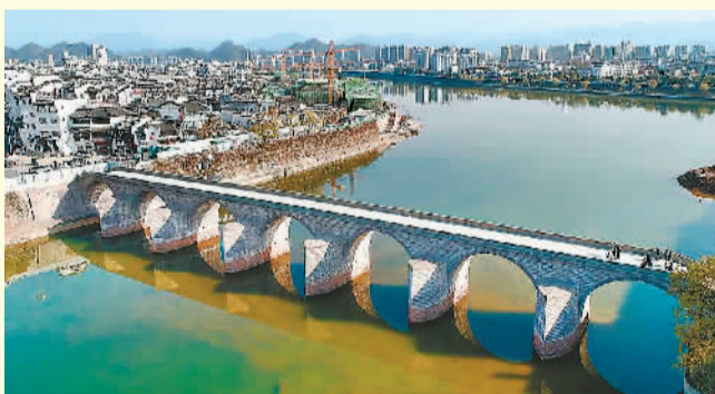
修缮后的屯溪镇海桥。