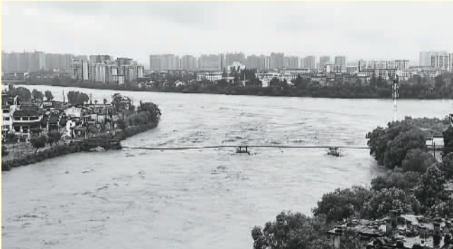
2020年7月7日拍摄的被冲毁后的屯溪镇海桥。