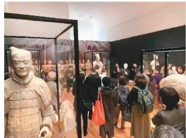
当地观众参观展览。

此次展览将持续至5月22日，之后将陆续在日本静冈县立美术馆、名古屋博物馆及东京上野森美术馆举办，并将于2023年2月5日闭幕。