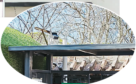
▲ 北京市朝阳区博雅园小区中控室的大屏幕上,清晰显示2号楼高楼层外立面。 ▶ 博雅园小区内安装的高空抛物监控设备。