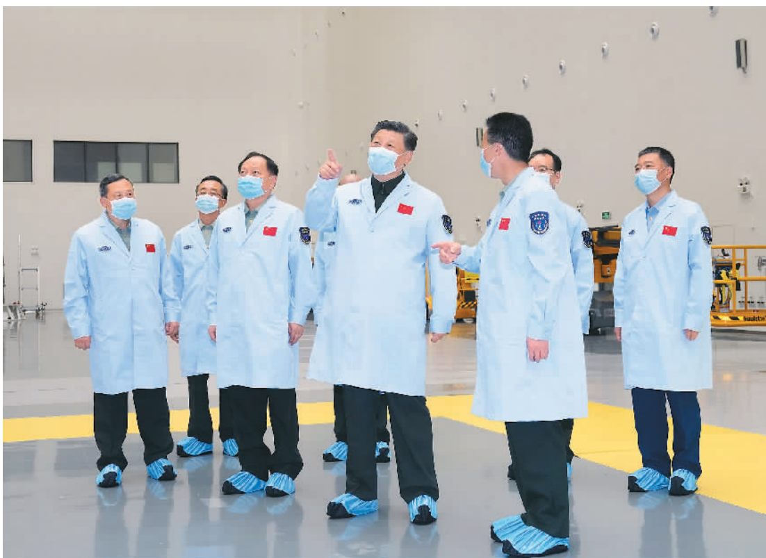
四月十二日下午,中共中央总书记、国家主席、中央军委主席习近平到文昌航天发射场视察,代表党中央和中央军委,向发射场全体同志致以诚挚问候。图为习近平来到技术测试厂房,详细了解有关任务准备情况。

■ 文昌航天发射场是我国新一代大推力运载火箭发射场,是我国深空探测的重要桥头堡,在我国航天体系中具有特殊重要地位和作用。要大力弘扬“两弹一星”精神、载人航天精神,坚持面向世界航天发展前沿、面向国家航天重大战略需求,强化使命担当,勇于创新突破,全面提升现代化航天发射能力,努力建设世界一流航天发射场 ■ 按照既定部署,今年我国将完成空间站建造任务,天舟四号、五号货运飞船和问天、梦天实验舱将从文昌航天发射场发射升空。要精心准备、精心组织、精心实施,确保发射任务圆满成功,以实际行动迎接党的二十大胜利召开