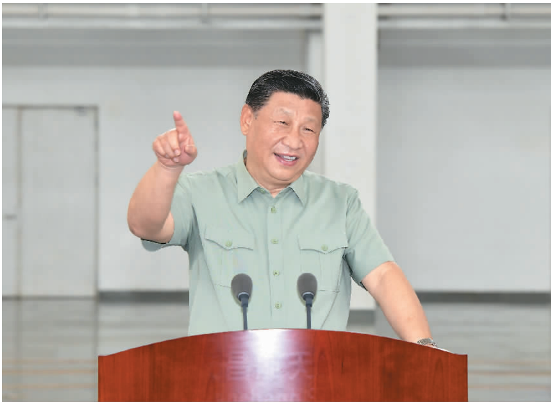
四月十二日下午,中共中央总书记、国家主席、中央军委主席习近平到文昌航天发射场视察,代表党中央和中央军委,向发射场全体同志致以诚挚问候。图为习近平发表重要讲话。