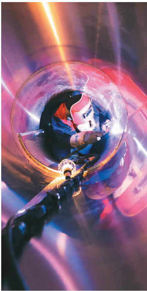
浙江省德清县钟管镇的一家智能装备企业车间里,工人在焊接加工零部件。