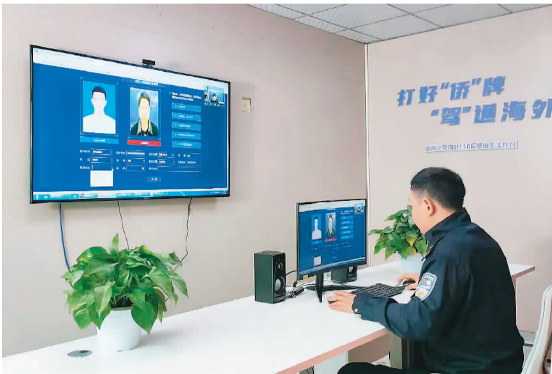
福州交警为海外侨胞远程办理驾驶证延期换证业务。

这样的故事并非个例。新冠肺炎疫情发生后，各地远程为侨服务更加精细化、规范化、便捷化，不断推出新举措、新平台，为海外侨胞排忧解难、提供便利。远程为侨，拉近侨心，海外侨胞更加深切地感受到来自家乡和祖（籍）国的温暖和关爱。