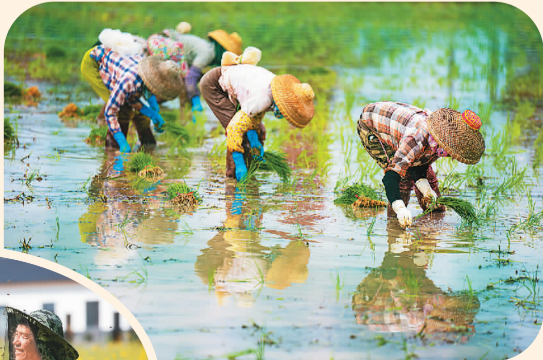
春日里，各地侨乡田间地头一派繁忙景象。