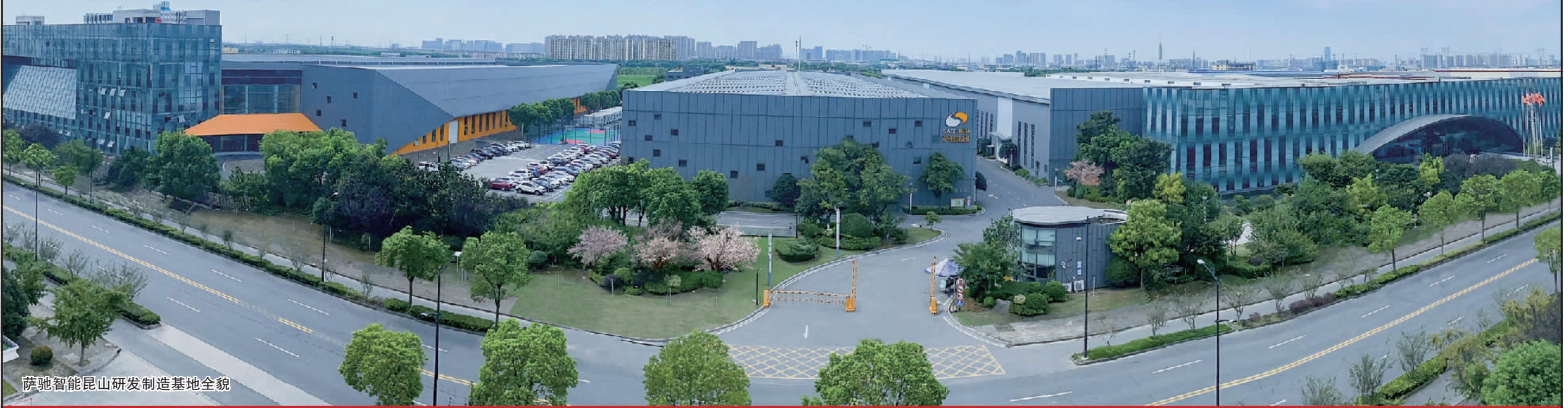
萨驰智能昆山研发制造基地全貌