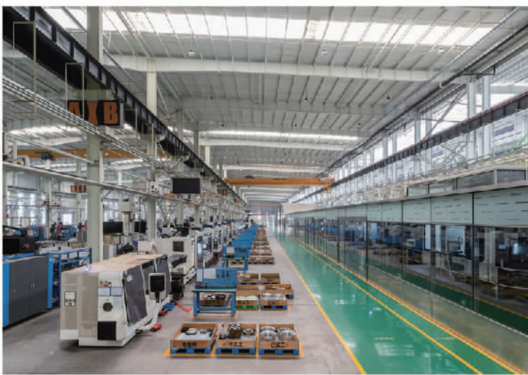
萨驰智能制造基地一隅