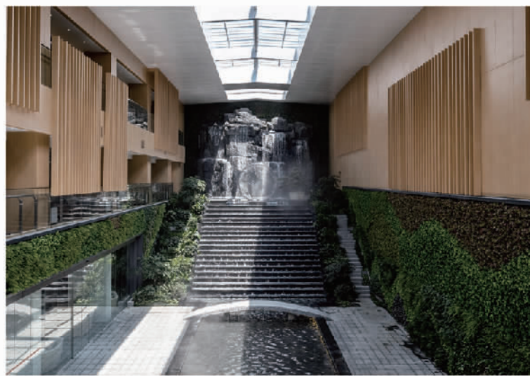
萨驰智能智慧产业研发基地