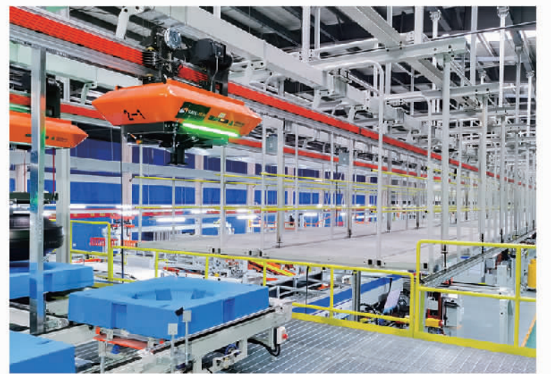
萨驰承建的玲珑轮胎长春工厂智慧物流项目