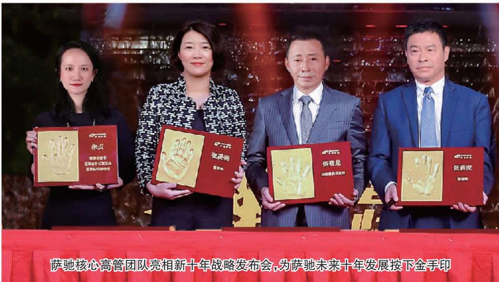
萨驰核心高管团队亮相新十年战略发布会,为萨驰未来十年发展按下金手印

萨驰智能装备股份有限公司(简称“萨驰智能”)总部坐落于江苏省昆山市,是中国技术领先的高端智能装备制造商及智慧工厂解决方案服务商,综合实力位居全球前列。在2020年全球橡胶机械行业企业的销售收入排名中位居第5位。