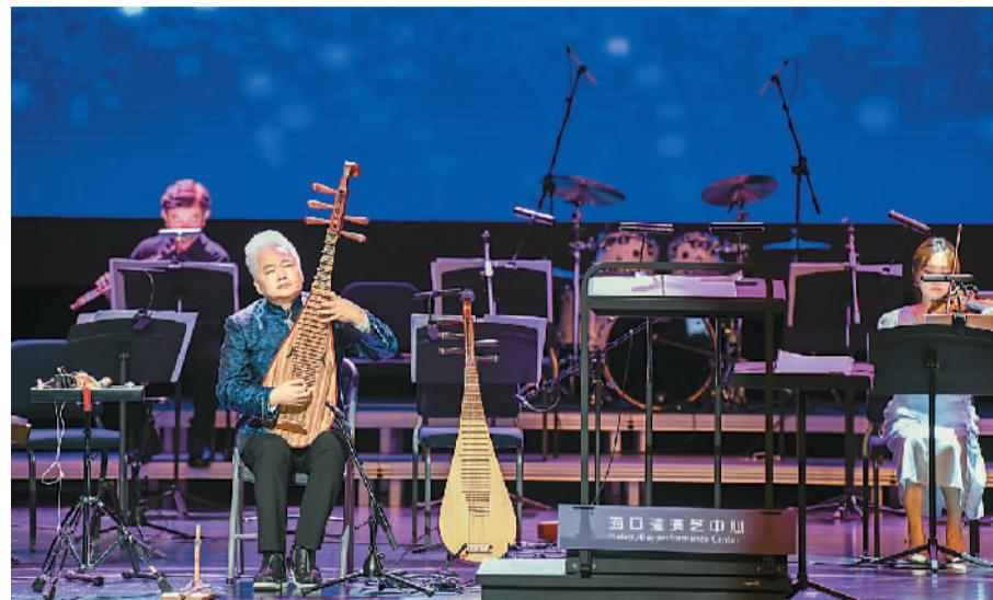
▲ 2021年6月，在海南省海口市海口湾演艺中心，国乐大师方锦龙联手新九州爱乐乐团，融合古筝、钢琴、琵琶、二胡与打击乐，演绎“国潮”魅力。

一部分国风歌曲吸收传统戏曲唱腔，大胆创新，收获大众喜爱。国风歌曲《赤伶》的歌词化用昆曲《桃花扇》的内容，表演者采用戏腔演唱，将流行音乐与戏曲元素巧妙融合。创作于2021年的《探窗》是一首以爱情为主题的国风歌曲，歌词凝练含蓄，富有古风意境。歌曲首发后，互联网涌现了诸多翻唱版本，其中上海戏剧学院学生采用京腔演唱的版本最令人瞩目，歌曲翻唱视频上传至短视频平台后迅速走红，播放总量超5000万，用户点赞量超250万，刷新了许多年轻人对中国传统戏曲的认识，也激发了观者模仿学习的兴趣。