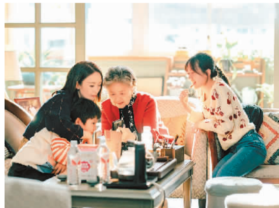
▲ 电视剧《心居》剧照。

以求和热切向往。滕肖澜说：“此心安处是吾乡。剧中大多数人都在为了心中所想而努力，顽强地生活和奋斗着。小人物亦有大情怀。”全剧从顾清俞和冯晓琴姑嫂二人的关系切入开始讲故事。顾家是都市本地人，代表着土生土长的都市人怎样生活，怎样在社会浪潮中发展；冯晓琴和妹妹冯茜茜是外地人，她们也在大都市闯荡拼搏，奔波忙碌。最终，每个人都获得了心灵的慰藉，寻找到了心之所居。滕华涛说，与传统都市女性题材剧不同，这部剧着重展现了生活和人性中温暖、善意的一面。“故事中有伤痛，但不沉湎于伤痛；故事中有都市生活的压力，但更多地着墨于人物的努力和自强。在《心居》的创作过程中，我希望能够做到真正地关注时代，扎根生活，真诚地展现人性的光辉，这是我的