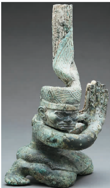
三星堆商代遗址四号坑出土扭头跪坐铜人像。

本次考古发掘新发现的遗迹和遗物，将促进关于三星堆遗址及古蜀文明的祭祀礼仪和祭祀体系研究；进一步阐释了“古蜀文明是中华文明重要组成部分”的基本认识。