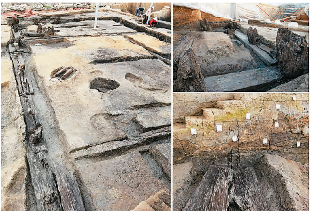
湖南澧县鸡叫城遗址发现大型木构建筑，图为基槽内铺垫木板。