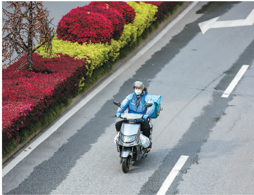
3月24日,在安徽省铜陵市铜官区长江路商业街,外卖骑手正为市民配送生活物资。

团长还有佣金;二是进店取货的消费者往往会在进店后顺带消费,相当于传统小店借助数字化引流。