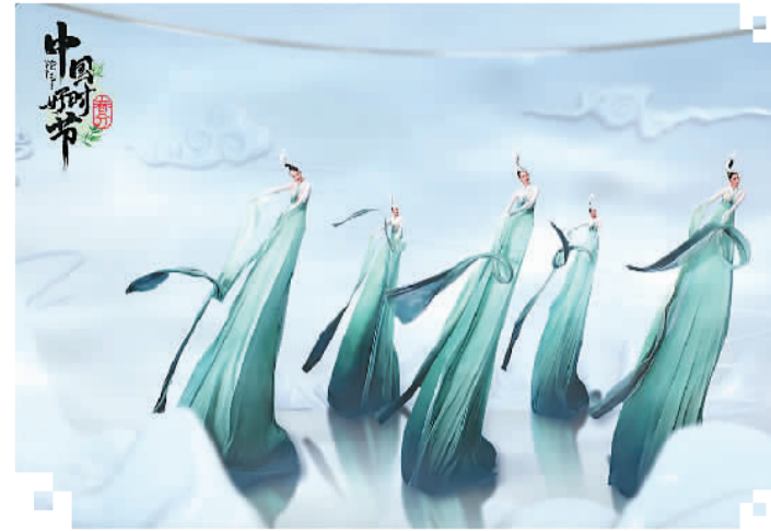
浙江卫视“中国好时节”系列晚会春分篇中的舞蹈《春茶意暖》剧照

《冰山上的来客》中，帕米尔高原的险峻冰峰、湍急河流和成群结队的双峰驼，极大地满足了观众对边疆风光的想象。《花儿为什么这样红》让帕米尔高原继《冰山上的来客》之后，再次出现在观众视野中。雪山、峡谷、艳阳、清流、峭壁、冰川，有雄伟、旖旎、壮美、磅礴的一面，也有严酷、冷漠、凶狠、无情的一面。影片中求学路上遇险、泪别濒死的牦牛、勇闯吾甫尔浪沟等片段，都体现了这种地形地貌对人类而言难以想象的