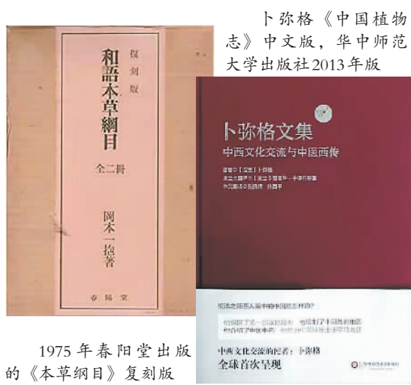
卜弥格《中国植物志》中文版，华中师范大学出版社2013年版