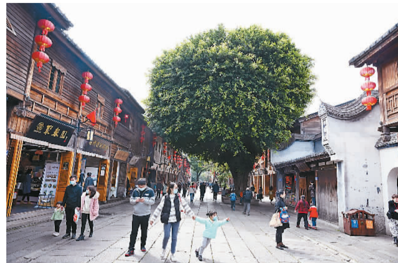
福建福州拓展城市绿色空间，一座座生态公园、一条条休闲步道陆续诞生。图为游客在三坊七巷文化街区南后街上游玩。

北麓形成无数季节性河流，横穿河西平原，一路向北奔腾至巴丹吉林沙漠腹地，滋养出生罗棋布的绿洲。车过高台，窗外的景致逐渐变得清晰起来，天空虽有阴云，却还明亮。不远处，三三两两的牦牛、绵羊悠闲地啃着矮蒿草，间或抬头注视飞驰而过的列车，一副气定神闲的模样。几只欢快的野骆驼追着铁轨上这条白色长龙，不一会儿便收住了脚步，疑惑地注视着它风驰