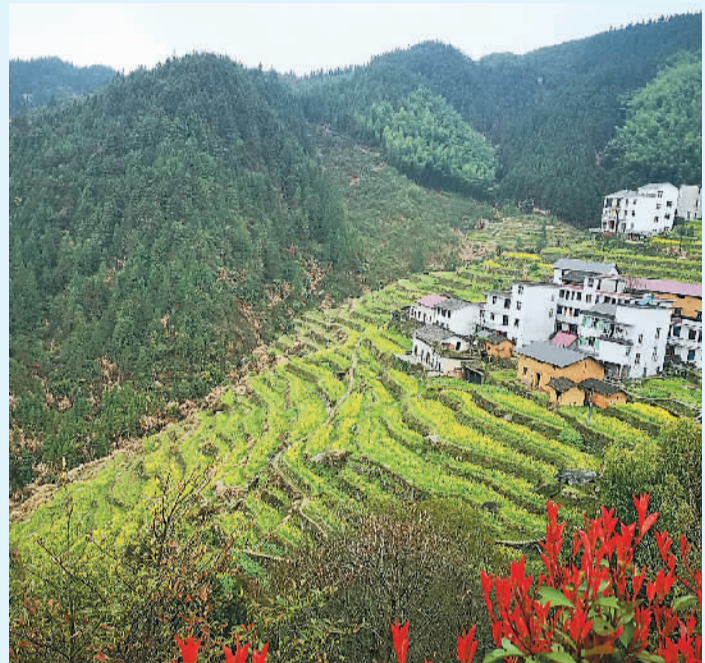
台回山的梯田与村庄。

寒。伫立观景台上俯瞰，群山犹如戴着葱绿的桂冠，油菜花则是山峰之间的金色烈焰，不事雕琢，尽得张旭酒后草书的真传，滴野的狂草，挥洒出艺术的气韵。在我看来，这是台回山精心设计的一个古老阵法，它以色彩为士兵，一朵衔接着一朵，一朵拥抱着另一朵，像不拒涓滴的河流，终于蔚为大观。此刻，山溪的水声和枝丫的鸟鸣合奏，桃花与梨花如同闲笔点缀，春天，正被台回山的花之波澜敲门。