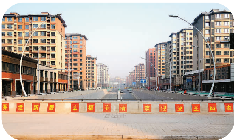
▲ 雄安新区容东片区E组团集中交付的安置房（1月17日摄）。地上建筑包含157栋住宅楼、2所幼儿园、1所小学及1所社区服务中心，共计9147户精装修住房，可安置居民近3万人。