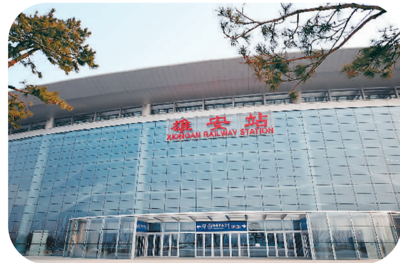
▲ 京雄城际铁路雄安站。新华社记者 骆学峰摄