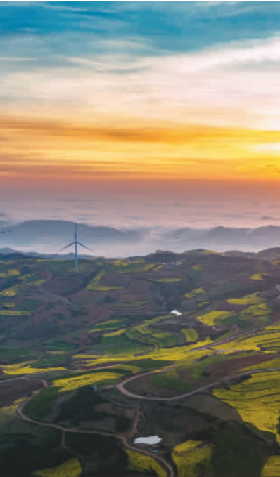
② 云南省曲靖市罗平县阿岗镇风电场风电设备与金黄油菜花交织在一起，成为一道亮丽绿色风景线。

中国坚定不移地贯彻创新、协调、绿色、开放、共享的新发展理念，推动高质量发展。光伏产业在中国走出了一条降本增效的绿色发展之路：日光资源丰富西北地区建立起光伏全产业链，为当地居民增加绿色收入；全国太阳能光伏装机容量保持快速增长，能源开发与利用格局不断改善；中国光伏企业技术水平已位于世界前列。