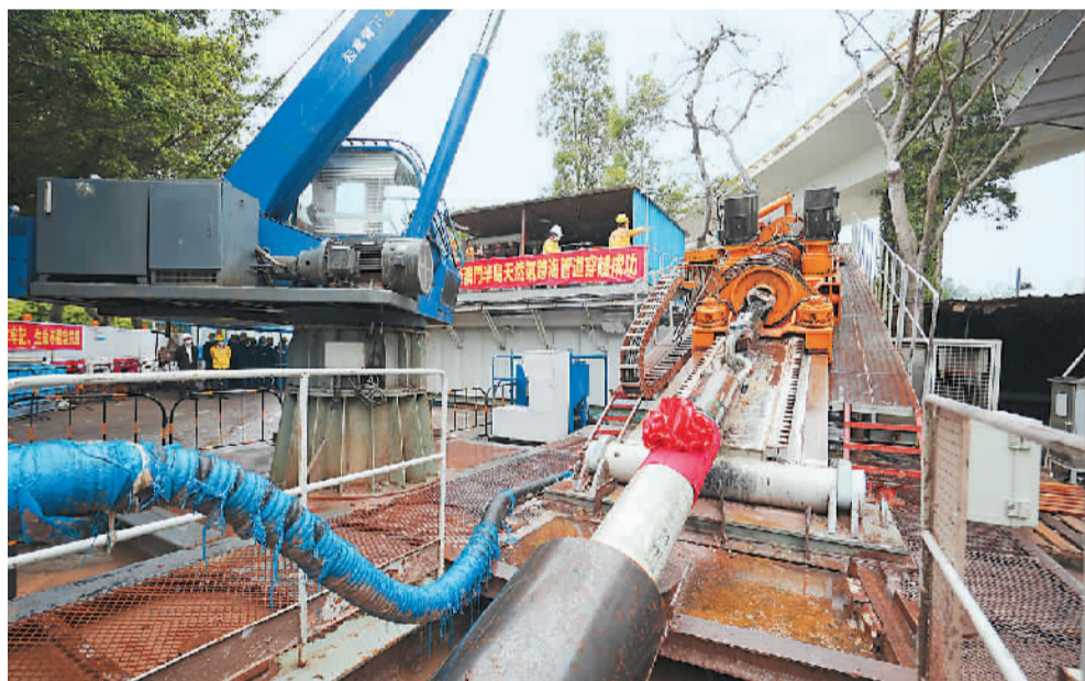
图为氹仔至澳门半岛天然气过海管道施工现场。

新华社澳门3月28日电 (记者刘刚、李寒芳)记者28日从澳门城市燃气有限公司获悉，由该公司投资建设的氹仔至澳门半岛天然气过