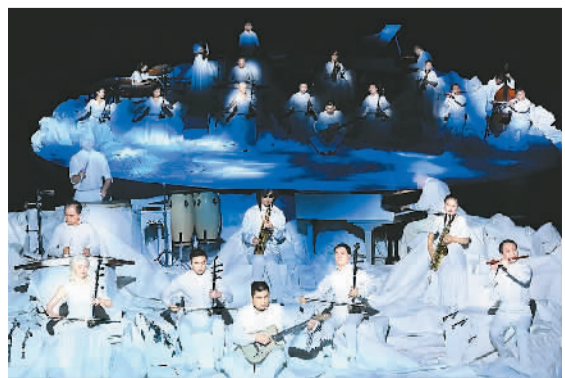
音乐会《永曜之花》现场舞台照

《永曜之花》共分“那个晚上”“温情陪伴”“音乐幻境”“生命绽放”“阳光续曲”5个篇章，艺术化地讲述了一个意外失明的孩子被爱治愈，逐渐走出自我禁锢，又机缘巧合步入音乐殿堂，在舞台上绽放光华，终于创造出属于自己的缤纷世界的温暖故事。音乐会的全部器乐演奏员都是盲人，演出现场没有乐谱提示，没有音乐指挥，演员们靠对声音的敏感、对音乐的执着、对生命的热爱，奏响了绚丽华章。作为北京文化艺术基金2021年度资助项目，演出推出全场惠民票价，从3月18日至20日在京连演5场，让更多百姓走进剧场，倾听盲人的故事。