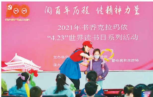
克拉玛依市举办世界读书日活动

地处新疆准噶尔盆地西北缘的克拉玛依市，是一个以石油天然气为主要产业的能源城市。自2016年成为第二批国家公共文化服务体系示范区以来，克拉玛依市深入挖掘特有的石油文化资源，开展文化润疆工程，通过改革创新，为人民群众提供不同层次、不同形式、不同风格的高品质公共文化服务产品，形成了创新发展公共服务的“克拉玛依模式”。如今，这颗因油而生、因油而兴的“黑色明珠”散发着缕缕文化清香，润泽着戈壁滩上的各族人民。